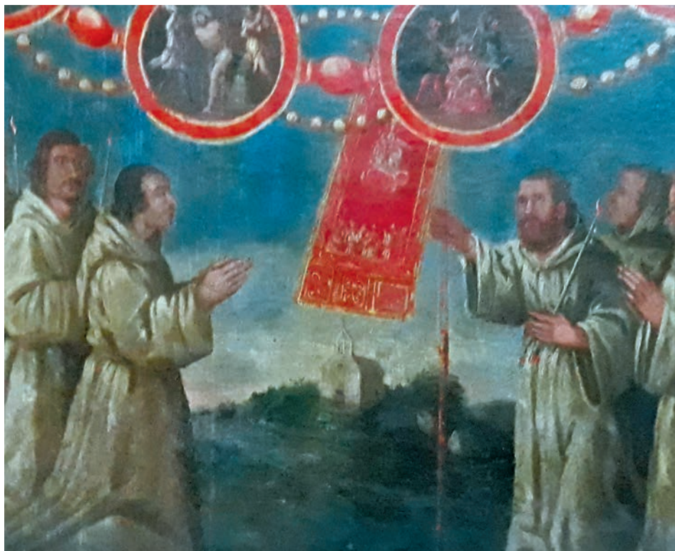
Detalj s pale Gospe od Ružarija