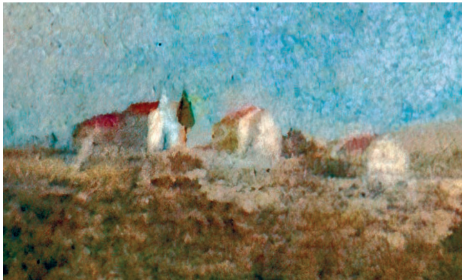
Detalj s najstarije fotografije Dola