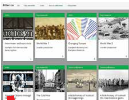
Različiti povijesni sadržaji na Historiani

Historiana nudi besplatne, visokokvalitetne povijesne sadržaje, uključujući primarne izvore te aktivnosti učenja i e-učenja. Platforma doprinosi misiji EuroClia da nadahne i osnaži nastavnike da uključe učenike u inovativnu i odgovornu nastavu povijesti te građanskog odgoja. Od 2021. godine, Historiana omogućuje pristup do više 50 zbirki izvora, 5 višestrukih vremenskih linija, 14 sadržaja koji prikazuju različitih gledišta, 50 aktivnosti e-učenja, 100 aktivnosti učenja i 3 modula usmjerena na ključne povijesne događaje: Prvi i Drugi svjetski rat te Hladni rat.