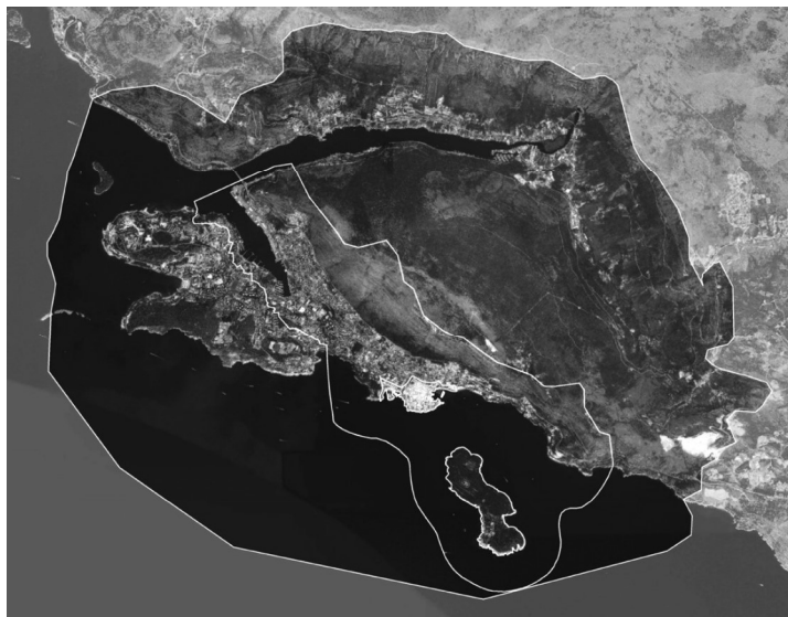
PROSTORNI OBUHVAT PODRUČJA SVJETSKOG DOBRA, KONTAKTNE ZONE I OKRUŽENJA

htjeva Operativnih smjernica UNESCO-a za Dubrovnik 4 , ali i zbog potrebe za razvojem sinergija i unaprjeđenjem trenutnog sustava upravljanja, što je i potvrđeno kroz participativni proces. Plan upravljanja svjetskim dobrom UNESCO-a 'Starim gradom Dubrovnikom' predstavlja prvi takav dokument namijenjen ukupnom povijesnom urbanom krajoliku Dubrovnika. Prostor je to koji čini svjetsko dobro, uključujući povijesnu gradsku jezgru, otok Lokrum i pripadajući akvatorij te kontaktno područje svjetskog dobra zajedno s njegovim okruženjem.