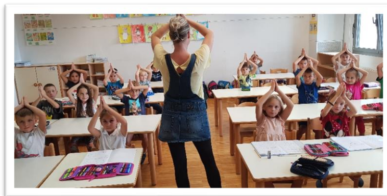
Vježba „Znak SLUŠAJ“