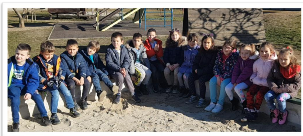
Vježba „Poslušajmo“