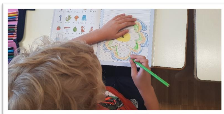
Vježba „Opuštanje“