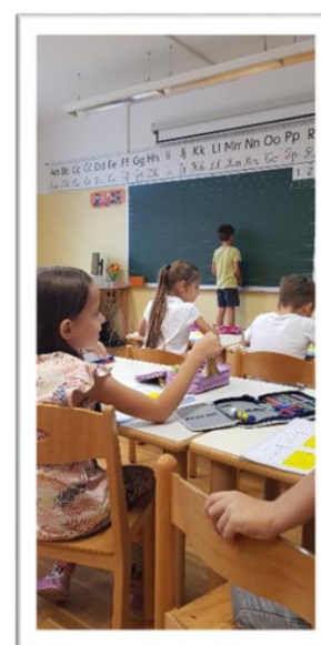
Vježba „Tko ima zvončić?“