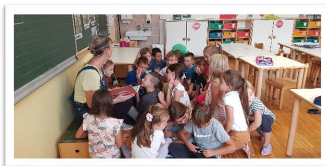
Vježba „Sve tiše i tiše“