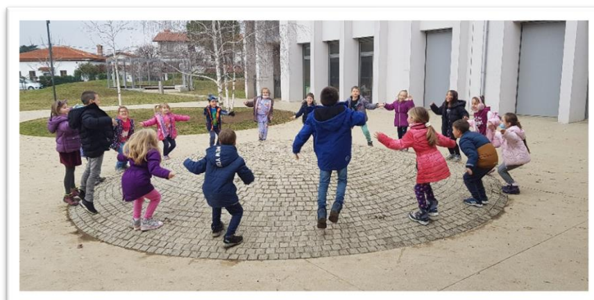
Vježba „Slušaj i uradi“