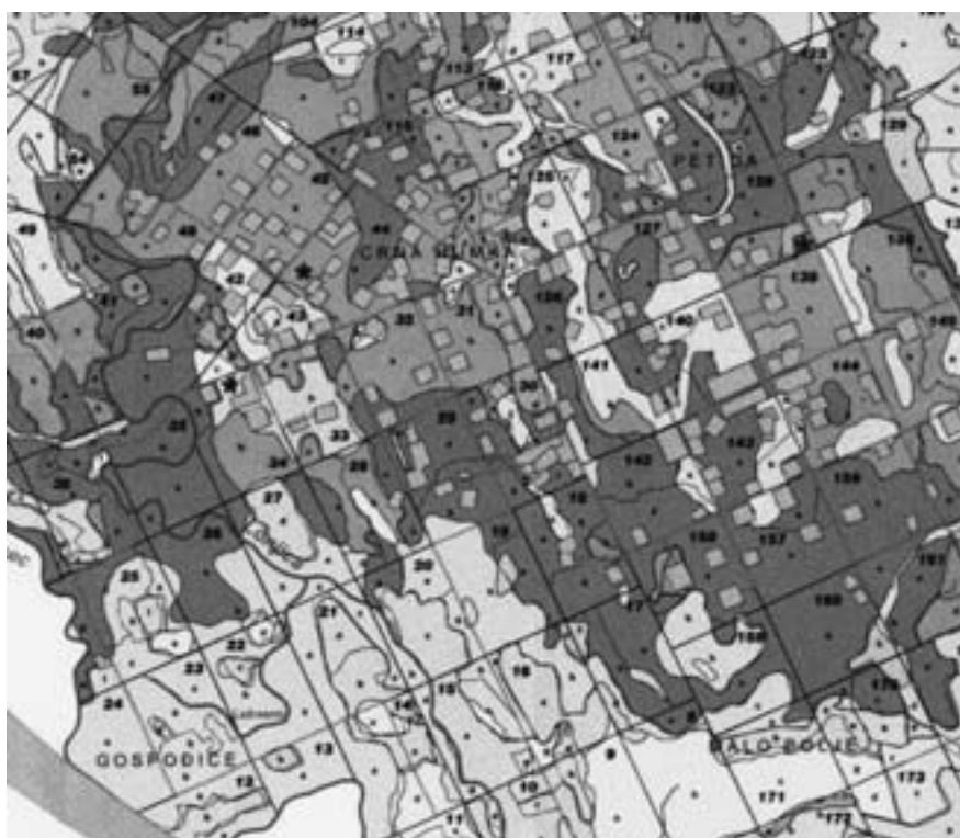
Slika 1. Razmještaj naftnih bušotina u Žutici Figure 1. Distribution of oil well in Žutica

Prema VRBEKU i PILAŠU (2000), u Žutici je izdvojeno 17 pedokartografskih jedinica te 8 pedosustavnih jedinica. Područje unutar šume na kojem dolazi najveći dio naftnih bušotina i pripadajućih cjevovoda nalazi se unutar srednjeg uzvišenijeg dijela šume na kojem prevladavaju tla tipa pseudoglej, pseudoglej-glej te močvarno glejno epiglejno tlo. Šuma Žutica predstavlja retenciju tj. dolazi do periodičnog plavljenja šume u koju se usmjeravaju visoki vodni valovi Save radi