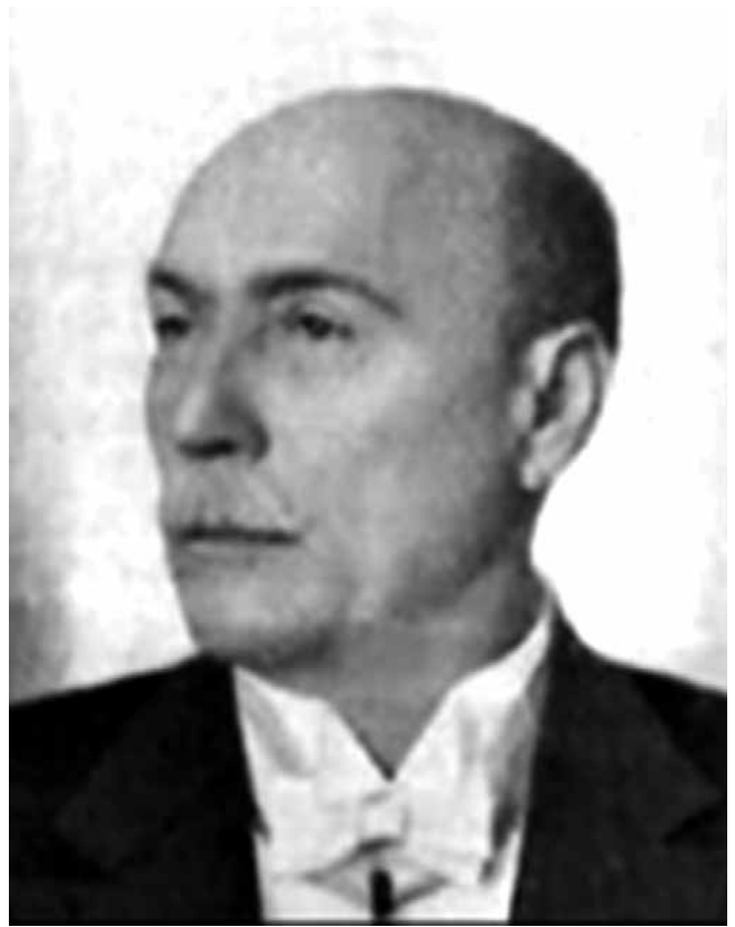
Slika 5. Gustav Pexider.

Vrijedi spomenuti i Osječanina Gustava Pexidera , koji je osamnaest godina djelovao kao profesor opće, agrikulturne i analitičke kemije te kao voditelj laboratorija Kraljevskog gospodarskog i šumarskog učilišta u Križevcima. Rođen je u osječkoj Tvrđi i kršten kao Gustavus Franciscus Xaverus. Bio je sin Ivana, prvog profesora fizike na osječkoj Realnoj gimnaziji. Pučko školovanje završio je u Osijeku, a srednjoškolsko u Beču. U Pragu je studirao na Visokoj tehničkoj školi. Diplomirao je u dvadesetoj godini, da bi 1879. godine stekao naslov profesora kemije. Te je godine, nakon što se vratio u Hrvatsku, imenovan profesorom opće, agrikulturne i analitičke kemije te voditeljem Kemijskog laboratorija na Kraljevskom gospodarskom i šumarskom učilištu u Križevcima. Od 1890. do 1897. godine bio je ravnatelj tog križevačkog Učilišta. Nakon gotovo dvaju desetljeća djelovanja u Križevcima premješten je u Osijek na radno mjesto profesora kemije i ravnatelja Kraljevske re-