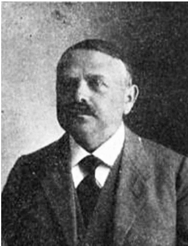
Slika 4. Mirko Breyer.

brojnih hrvatskih znanstvenika, književnika, pjesnika i onodobnih zaljubljenika u knjige. Odmah nakon primjene rasnih zakona u Nezavisnoj Državi Hrvatskoj, i to usprkos tome što su mu priznata arijska prava zbog čega nije morao nositi židovski znak, u sedamdeset i osmoj godini života odveden je s grupom slobodnih zidara i zatvoren u Staroj Gradiški, gdje je proveo šest mjeseci. Tijekom 1942. i 1943. godine bio je zatvaran još dva puta. U zatočeništvu je napisao dirljivu pjesmu U sabirnom logoru . Bio je član Društva hrvatskih književnika, PEN kluba, predsjednik Kluba knjižara, prvi predsjednik anticionističkoga udruženja Narodni rad, povjerenik Arheološkog muzeja u Zagrebu, član Hrvatskoga starinskog društva u Kninu, Hrvatskoga glazbenog zavoda, Društva umjetnosti, Bratovštine hrvatskih ljudi u Istri i Matice