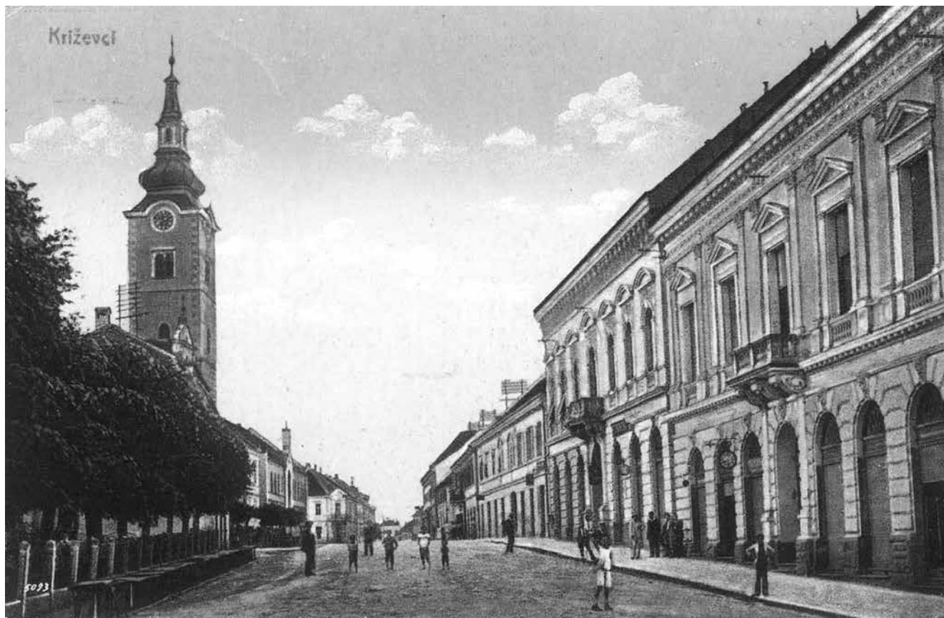
Slika 1. Grad Križevci, 20. stoljeće.