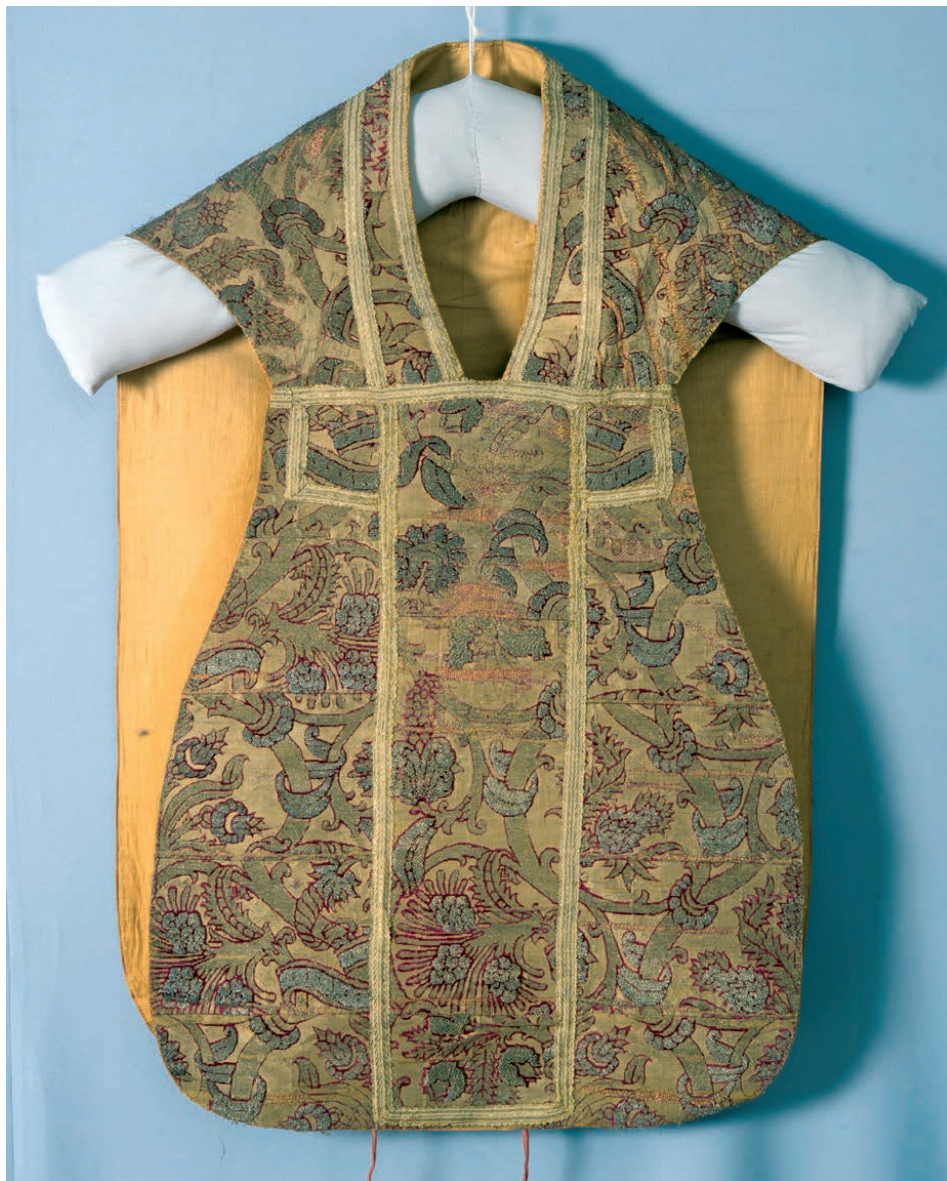
Kazula iz 16. st., preuzeto iz Marta Budicin - Sanja Lucić Vujičić, Renesansna misnica od zlatnog baršuna iz hvarske katedrale , Portal - godišnjak hrvatskog restauratorskog zavoda 10/2019., 73-96.