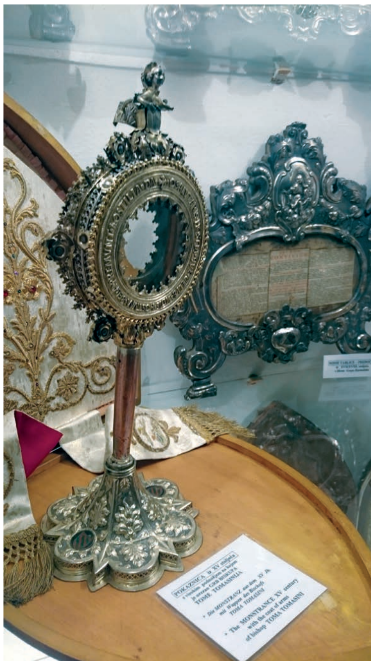
Pokaznica iz XV. stoljeća sa visokim podnožjem na kojem je urezan grb Biskupa Tome Tomasinija