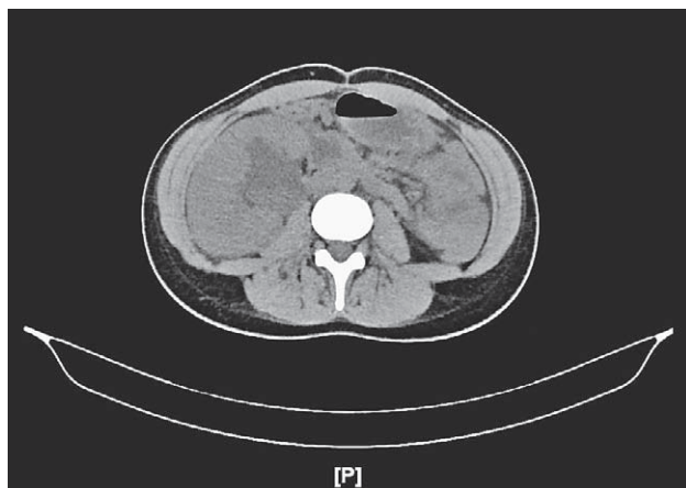
SLIKA 1. MSCT PRIKAZ DESNOG BUBREGA U TRENUTKU POSTAVLJANJA DIJAGNOZE

FIGURE 1. MSCT SHOWING RIGHT KIDNEY AT THE TIME OF DIAGNOSIS