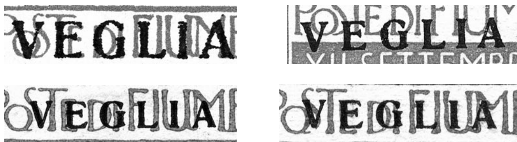
Primjer falsificiranja kompletnih serija krčkih maraka: