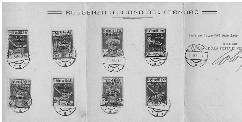
Primjer falsificiranja pretisaka VEGLIA: