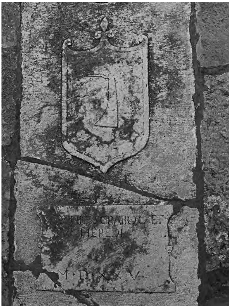
Sl. 5 „Grb“ na nadgrobnoj ploči u podu u dvorištu benediktinskog samostana sv. Marije anđeoske u Krku