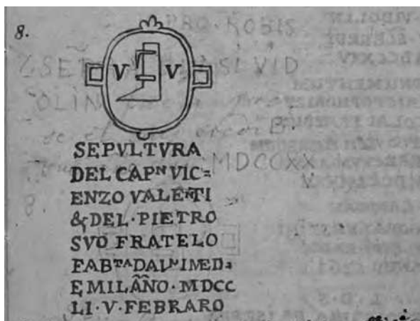
Sl. 6 Crtež „grba“ s nadgrobne ploče u podu crkve sv. Frane u Pagu

njezina imena. Ferre znači donositi, a fors znači priliku. Glavna mjesta štovanja njezina kulta su Rim, Praeneste i Antium. Fortuna se štuje u raznim oblicima i njezino je značenje kao božice raznoliko. Fors Fortuna se, primjerice, vezuje uz agronomiju i zaštitu nižih slojeva društva i robova. Upravo stoga što se veže uz različita značenja teško je interpretirati sam prikaz božice Fortune. Njezine različite osobine uvjetovale su i pojavu različitih epiteta uz samo ime Fortuna. Razlikujemo Fortunu Stabilis , Fortunu Brevis , Fortunu Dubiu , Fortunu Respiciens itd.