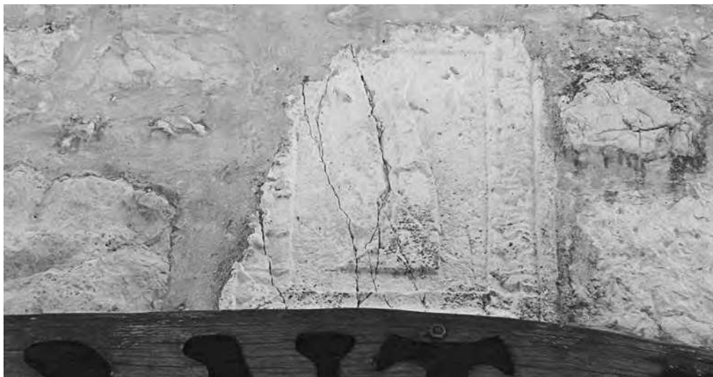
Sl. 4 „Grb“ uzidan na kući u staroj gradskoj jezgri, Ul. Dinka Dokule 6

u župnom uredu u Supetarskoj Dragi, istovjetan heraldički motiv predstavljen je u drugačije oblikovanom okviru na pročelju jedne zgrade u povijesnoj jezgri grada Raba (sl. 4). Uzidan je na pročelju višekratno pregrađene kuće s velikim unutarnjim dvorištem nalik na plemićke palače. „Grb“ je smješten odmah iznad ulaznog portala. Po sredini ima pukotine, a oštećen je i u gornjem lijevom uglu. Heraldička reljefna slika nalazi se unutar pravokutnog okvira oblikovanog nizom motiva lišća.