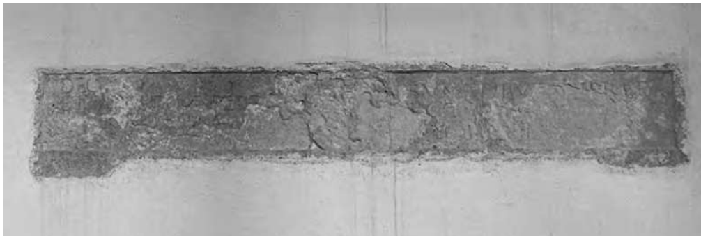
Sl. 2 Nadvratnik uzidan na unutarnjem licu sjevernog zida rapske katedrale