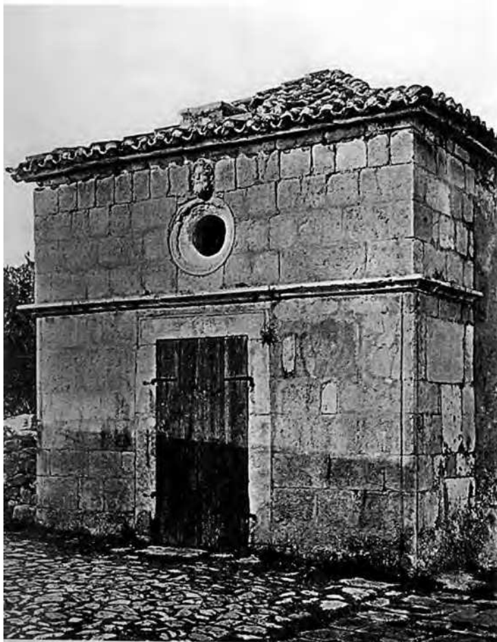
Sl. 7 Fotografija kapele sv. Petra s početka 20. stoljeća (preuzeto iz: DOMIJAN 2007)

Galzigna na Pjacetu, preko puta crkve sv. Justine, na više mjesta u kućama u Gornjoj ulici, u uglu pročelja katedrale, ali i u uglu kapele sv. Katarine te u prizemlju katedralnog zvonika.