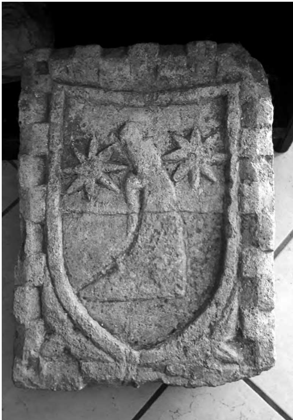
Sl. 1 „Grb“ u župnom uredu u Supetarskoj Dragi / privatno vlasništvo