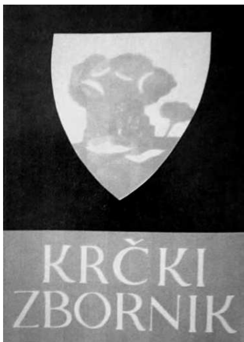
Krčki zbornik, sv. 2., Krk 1971. (koricе: Mila Kumbatović)