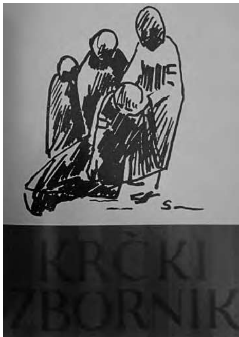
Krčki zbornik, sv. 11., Krk 1982. (korice: Svetlana Volarić)

Današnje promišljanje vizualne komunikacije i kulture te teorije vizualnog općenito svim je uređenim društvenim formacijama zadalo zadatak konstruiranja simboličnog lica , odnosno raspoznavanja svake