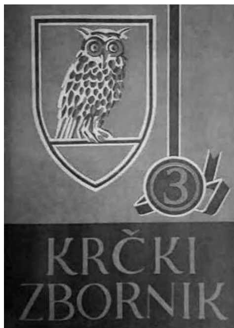
Krčki zbornik, sv. 3., Krk 1971. (koricе: Anton Depope)

ljubljenike u mjesnu krčku povjesnicu i spomeničku baštinu otoka, kao i u materijalno te nematerijalno pučko nasljeđe, bilo da su stručnjaci – znanstvenici (povjesničari, arheolozi, povjesničari umjetnosti, etnolozi, jezikoslovci – napose kroatisti itd.) ili samo amateri – entuzijasti, s krajnjim ciljem promicanja, istraživanja i čuvanja različitih aspekata prošlosti Zlatnog otoka, kako one davne, tako i ove recentnije, kao i ostalih otočnih fenomena te posebnosti u sklopu sredozemnog i srednjoeuropskog prostora.