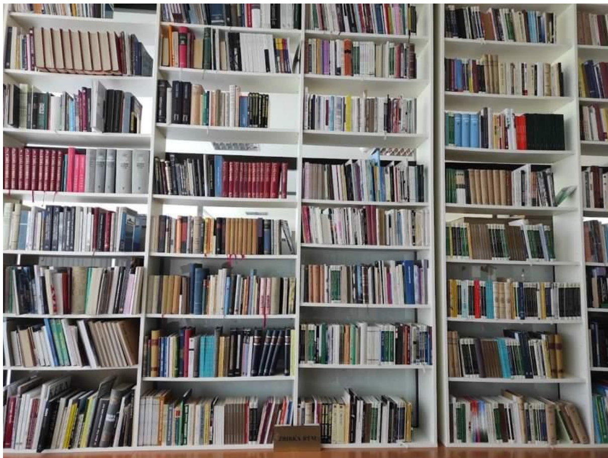
Slika 3. Smještaj Zbirke Rem unutar Zavičajne zbirke Brodensia 9

Legat Rem nastao je od darova drugih autora legatoru (darovi su uglavnom s posvetom), od vlastitih tiskanih djela, od djela drugih autora kojima je Vladimir Rem bio recenzent, autor predgovora, pogovora ili kritičkog osvrta i, najvjerojatnije, ciljanom kupnjom.