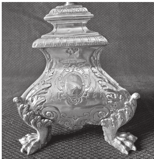
Sl. 4. Podnožje svijećnjaka s ugraviranim grbom biskupa Alvisea Lippomana (snimio: D. Ciković)

Dobrinju, Cresu, Pagu i Rovinju 24 te u crkvama franjevačkih samostana na Košljunu i Hvaru. 25