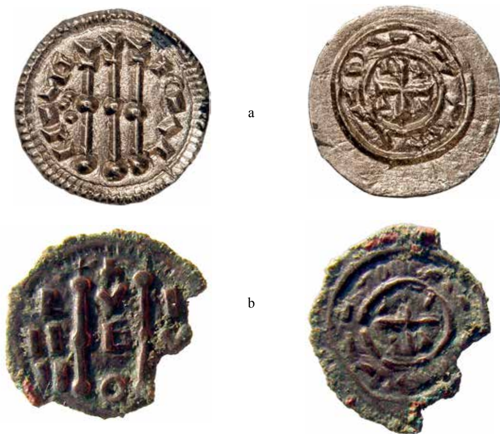
Slika 1. a-b. Kolomanov denar iz Donjih Lepura (a) i splitski komunalni novac iz Vrane (b) Figure 1 a–b. Coloman's denar from Donji Lepuri (a) and Spalatine communal coin from Vrana (b)

li. No gotovo su im identični reversi. Na oba su dvije koncentrične, linearne, ne posve pravilne kružnice, od kojih je vanjska uža od promjera novca. Zajedničko im je i to što u središtu unutarnje kružnice imaju istostranični križ s geometrijskim motivom u kutovima krakova. Prikaz s kraljeva novca očito je utjecao na izgled splitskoga. Ta njihova velika podudarnost u likovnome sadržaju, osobito onome na reversu, upućuje na to da pripadaju vrlo bliskomu vremenu. Dakle, čini se da je uspješno organizirana Kolomanova intervencija u stvaranju prerogativa ugarske vlasti nad Splitom utrla put k potrebi kovanja platežnoga sredstva zbog skupljanja novčanog poreza. Uostalom, da je kraljevski porezni činovnik u Splitu zaista i postojao, govori Toma Arhidakon. 16