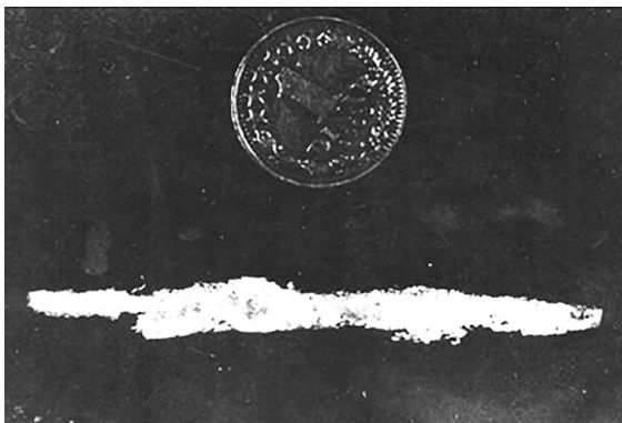
Slika 3. Uređaj za ultrabrzu kaljenje slitina (lijevo) i prvi uzorak dobiven tim uređajem 1969.