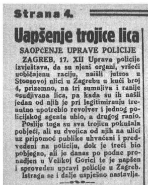
Sl. 3: Jutarnji list (br. 7863, 18. 12. 1933.) o hvatanju troje sumnjivih lica (ne spominje se pokušaj atentata)