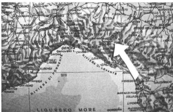
Sl. 1: Geografska karta Đenovskog zaljeva, na kojoj je prikazan položaj ustaških logora Borgo Val di Taro i Vishetta (u blizini Bardija).

“Uniforma je svetlo sive boje. Bluza se zakapča po sredini sa običnim dugmetima, a ne metalnim. Sprijeda je posve zatvorena i imade niski ovratnik. Hlače su isto tako