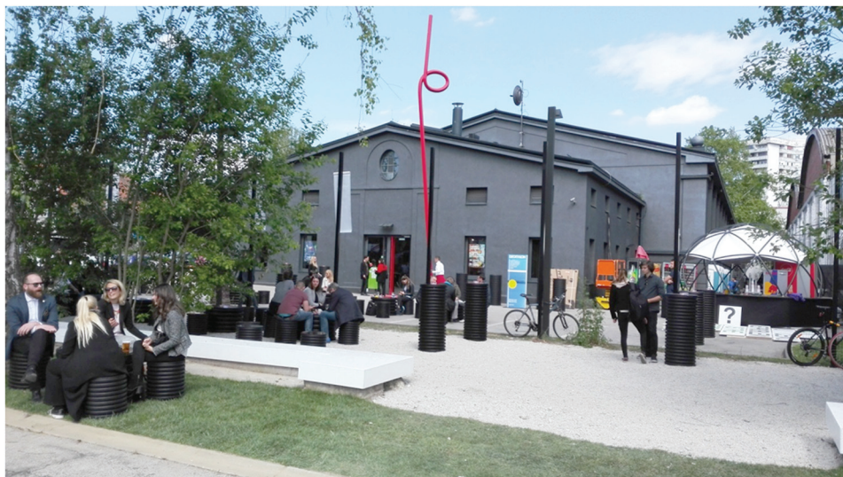
Slika 1. Lauba – kuća za ljude i umjetnost, u jašioni Konjaničke vojarne.