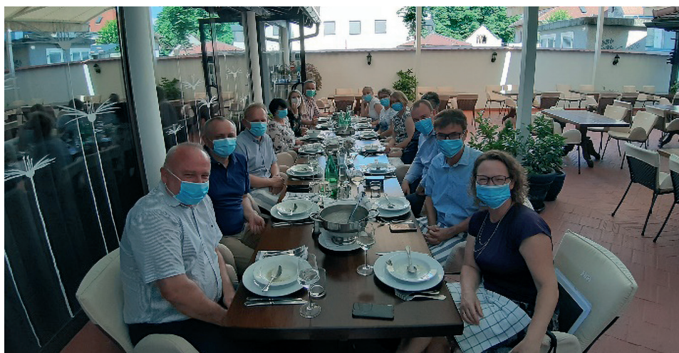
Slika 3. 65. sjednica Predsjedništva HGD-a.