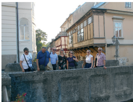
Slika 5. Razgledavanje grada Samobora.

Pod točkom br. 13 – razno, održao se ručak pridržavajući se kao i za vrijeme sjednice svih mjera prevencije i zaštite (slika 3) te razgledavanje grada Samobora (slike 4 i 5).