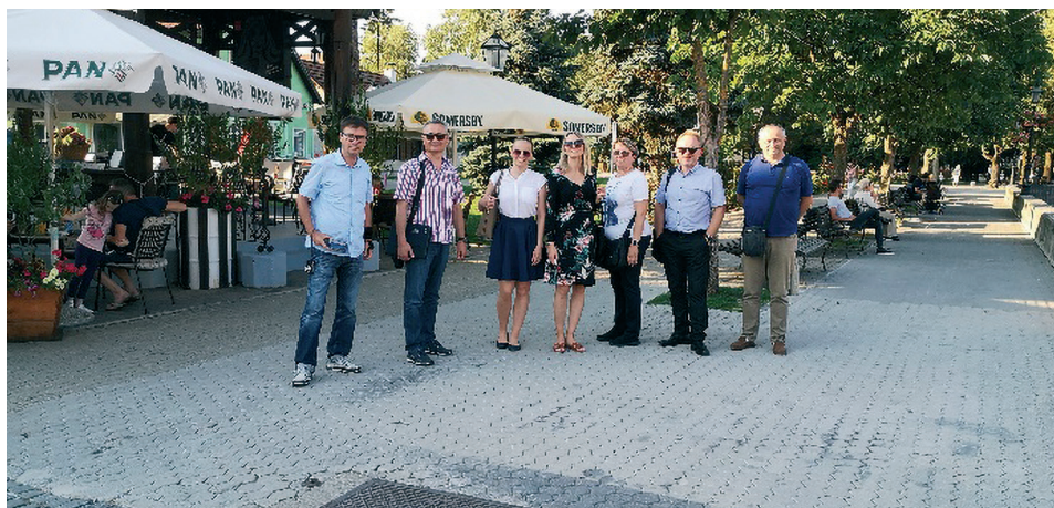
Slika 4. Razgledavanje grada Samobora.