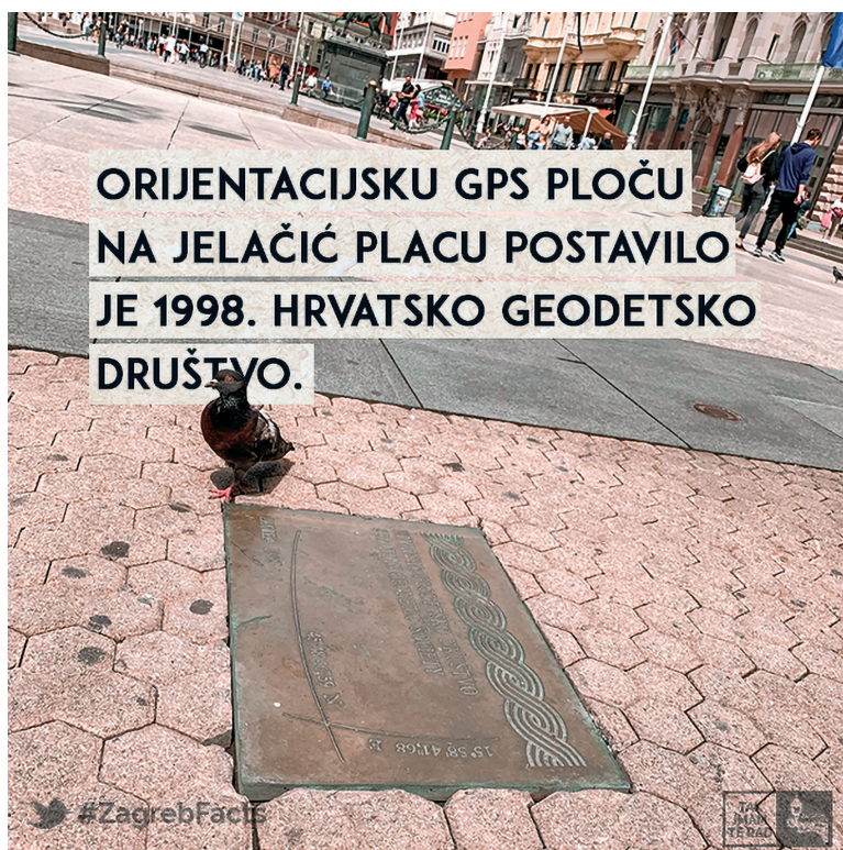
Slika 2. OrijeKCIJSKA ploča HGD-a.

Na kraju je Predsjednik HGD-a podnio i financijsko izvješće iz kojeg je bilo razvidno da su sve obveze podmirene prema svima dobavljačima te da društvo u ovome trenutku nema financijskih poteškoća.