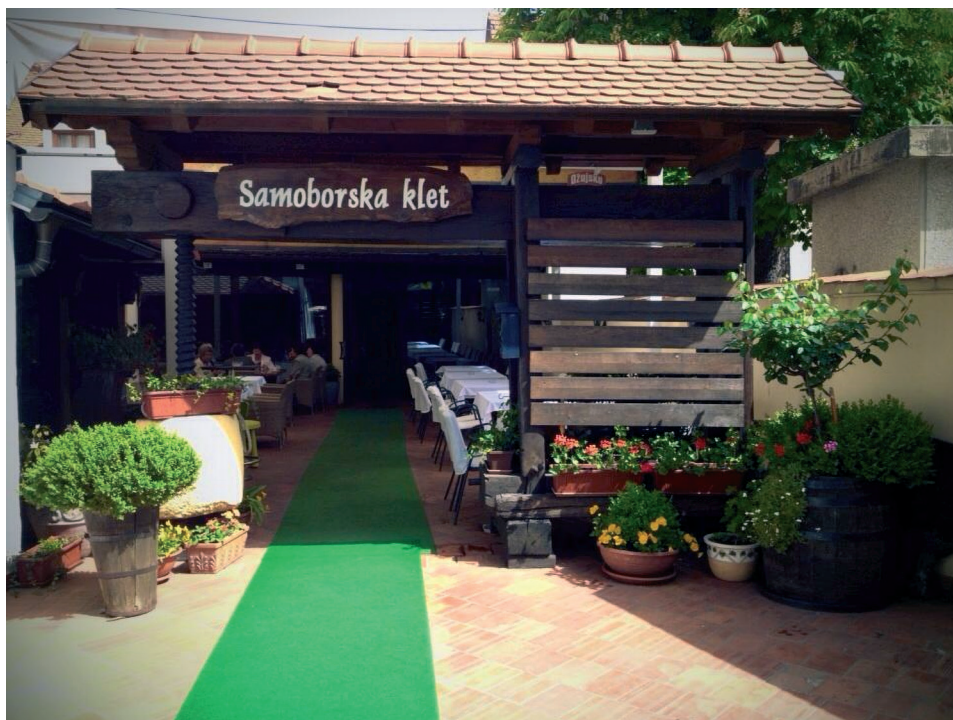
Slika 1. Restoran Samoborska klet.