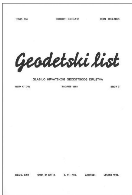
Slika 5. Naslovnica Geodetskog lista br. 2 iz 1993.