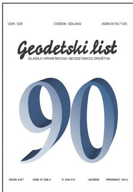
Slika 6. Naslovnica Geodetskog lista br. 4 iz 2013.