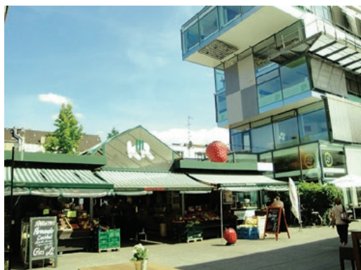
Sl. 7. Behnisch zgrada i gradska tržnica.

vezničkim bombardiranjima tijekom Drugog svjetskog rata. Građevine koje su to preživjeli, interpolacijama, osobito u središtu grada, pre- tvorene su u jedinstven urbani prostor. Jedan od takvih prostora je Königstraße, trgovačka ulica u centru grada koja je 2000. nadsvođena staklenom nadstrešnicom u duljini od 520 me- tara. Dugo je taj prostor bio zapostavljen kao i mnogi drugi koji su uništeni tijekom rata. Sli- čan primjer nalazi se u Hubertusstraße, gdje su ostaci vrata srušene crkve iskorištena za vrata dječjeg vrtića Marianum. Behnisch zgrada, do- bila ime po istoimenom arhitektonskom ure- du, izgrađena je 2002. najmodernija je građe- vina u Krefeldu. Izgradnja ove moderne zgrade sa sedam etaža oko 190 metara dužine dovela je do burne rasprave o suvremenoj arhitekturi. Iza njezine uglavnom staklene fasade nalaze se trgovine, ordinacije, uredi i restorani. Nastala je na nekadašnjem neasfaltiranom parkiralištu, a danas se ispod nje nalazi podzemna garaža. Okolo Behnisch zgrade nalazi se tržnica i brojni ugostiteljski objekti. Njezina izgradnja dovela je do oživljavanja centra grada. Od građevina izgrađenih 2016. u Krefeldu, ističe se prvi mi- naret na Yunus-Emre džamiji kao jedan od naj- modernijih minareta u Njemačkoj i djelomična rekonstrukcija Avenije Ostwall.