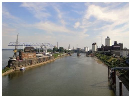
Sl. 2. Krefeldska luka na Rajni