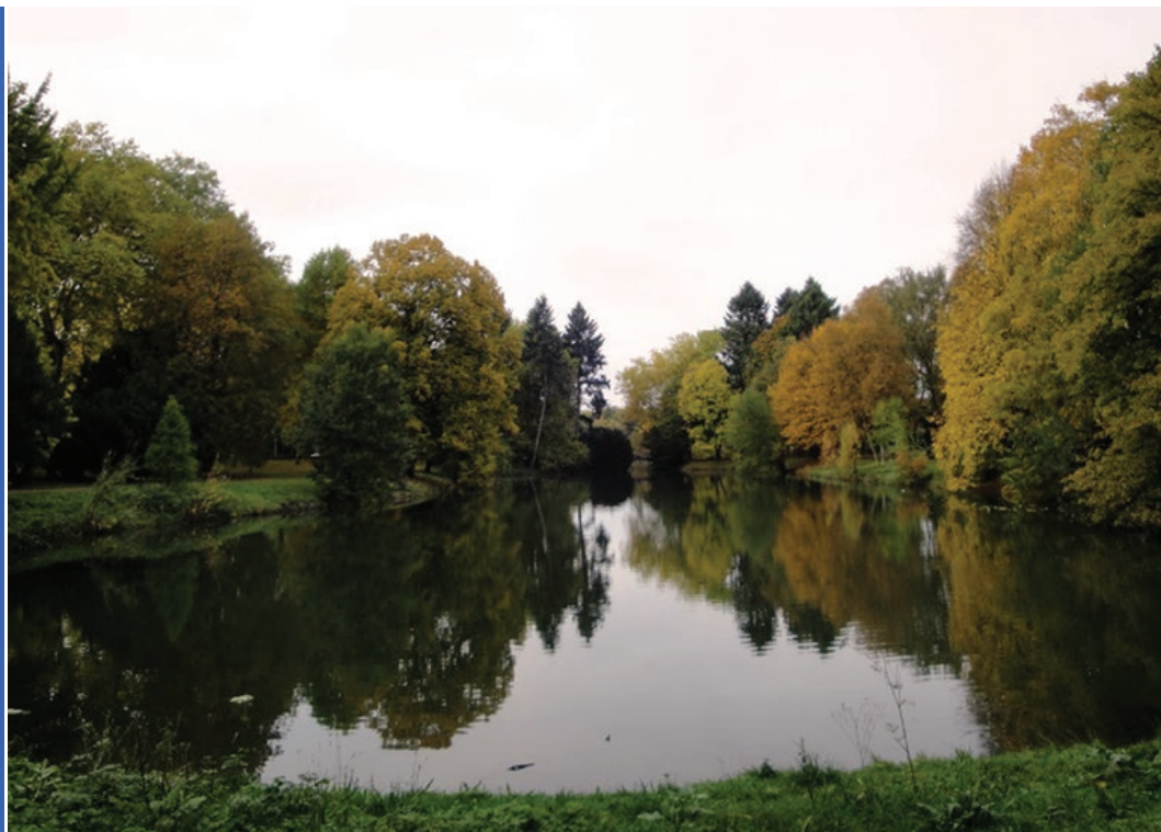
Sl. 4. Jezero u Stadtwaldu

oko 50 000 stanovnika su se izjasnili kao protestanti ili 21 % od ukupnog broja stanovnika. U Krefeldu živi i oko 25 000 muslimana ili 10 % stanovništva. Židovska zajednica broji 1200 članova, a u manjem broju postoje i pripadnici ostalih vjeroispovijesti kao što su grkokatolici, budisti i hinduisti ( www.wz.de/lokales/krefeld/katholische-kirche , www.ekir.de/krefeld ). U Krefeldu, stariji stanovnici govore posebnim dijalektom njemačkog jezika tzv. Krieeuwelsch-Platt ili holandski Platt , mješavini standardnog njemačkog i nizozemskog. Krefeld je podijeljen u devet općina; Centar, Zapad, Sjever, Jug, Istok, Hüls, Fischeln, Oppum-Linn i Uerdingenu, a one su podijeljene u 19 gradskih četvrti: Bockum, Elfrath, Fischeln, Gartenstadt, Hüls, Linn, Traar, Uerdingen, Oppum, Gellep-Str-