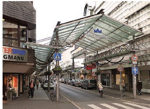
Sl. 6. Königstraße

Krefeld je grad iznenađujuće raznolikosti, urbane ljepote u jedinstvenom krajoliku donje Rajne. Gradom dominiraju parkovi s veličanstvenim dvorcima, secesijske zgrade u predgrađima, sačuvana priroda na brdu Hülser i u nekoliko zaštićenih prirodnih rezervata. Jedna od najstarijih građevina, sačuvanih do danas, je menonitska crkva koja je svjedok povijesti vjerske tolerancije u Krefeld. Izgrađena je 1693., a prvo korištenje zabilježeno je 1696. i od tada kontinuirano ju koristi zajednica menonita. Godine 1843. napravljena je veća rekonstrukcija sa povećanjem apside. U crkvi su 1961. postavljene orgulje iz radionice Rudolfa