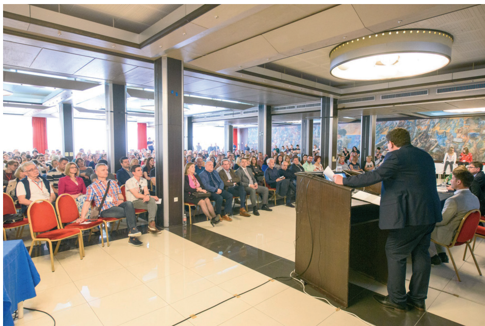
Slika 7. Predavanje, subota 11. svibnja 2019.