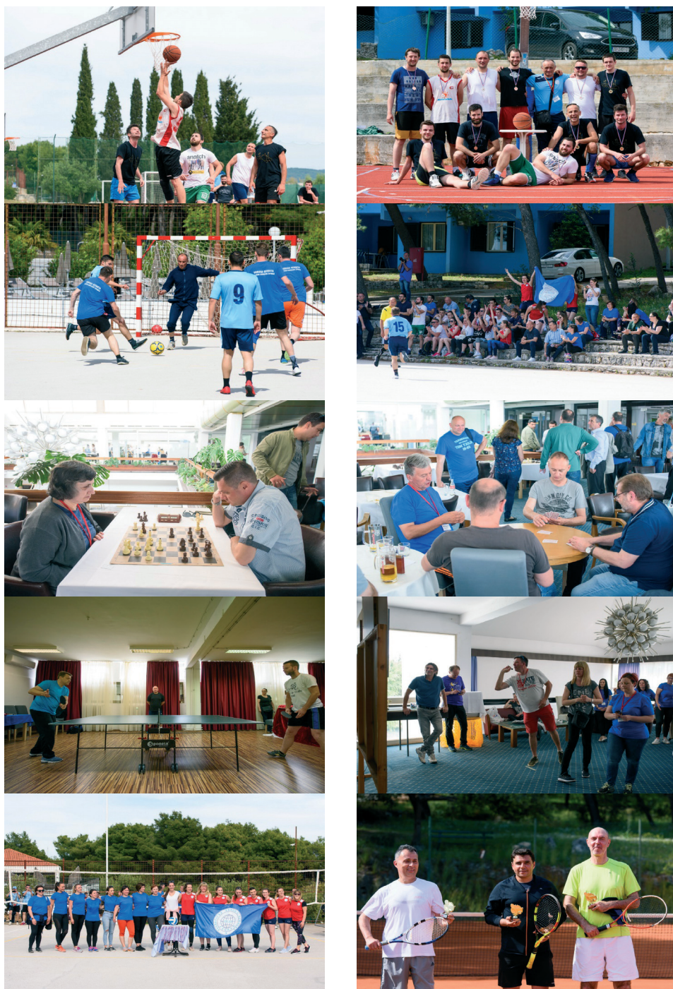
Slika 8. Sportske igre.