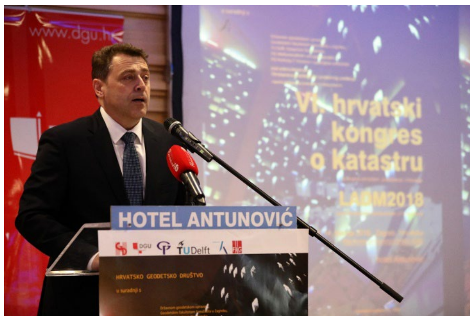
Slika 4. Ravnatelj Državne geodetske uprave Damir Šantek pozdravlja okupljene.