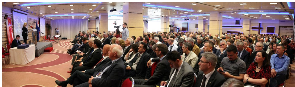
Slika 1. Svečano otvaranje VI. hrvatskog kongresa o katastru i radionice LADM2018.

Na svečanosti otvaranja kongresa (slika 1) u prepunoj dvorani Beethoven hotela Antunović okupljene su redom pozdravili predsjednik Hrvatskoga geodetskog društva i predsjednik organizacijskog odbora kongresa Rinaldo Paar, predsjednik znanstvenog odbora Miodrag Roić, predsjednica Međunarodne udruge geodeta (FIG) Chryssy Potsiou, ravnatelj Državne geodetske uprave Damir Šantek, pomoćnik ministra graditeljstva i prostornoga uređenja Milan Rezo te potpredsjednik Vlade RH i ministar uprave Lovro Kušević (slike od 2 do 5).