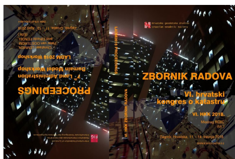
Slika 8. VI.HKK&LADM2018 – zbornik radova.

Svi radovi dostupni su u objavljenom zborniku radova (slika 8), kao i u digitalnom obliku na službenim web-stranicama kongresa: http://www.geof.unizg.hr/VIH-KKLADM2018/ . Kako su se na kongresu održale dvije konferencije – VI.HKK i LADM2018, objavljen je jedan zajednički zbornik radova, tiskan s dvije strane tako da su na jednoj radovi sa VI.HKK, a na drugoj s radionice LADM2018 (slika 8). Radovi za VI.HKK su djelomično na hrvatskom i djelomično na engleskom jeziku, a za LADM2018 su svi radovi na engleskom jeziku. Glavni urednici zbornika radova su: Miodrag Roić (VI.HKK) te Christiaan Lemmen, Peter van Oosterom i Elfriede Fendel (LADM2018).