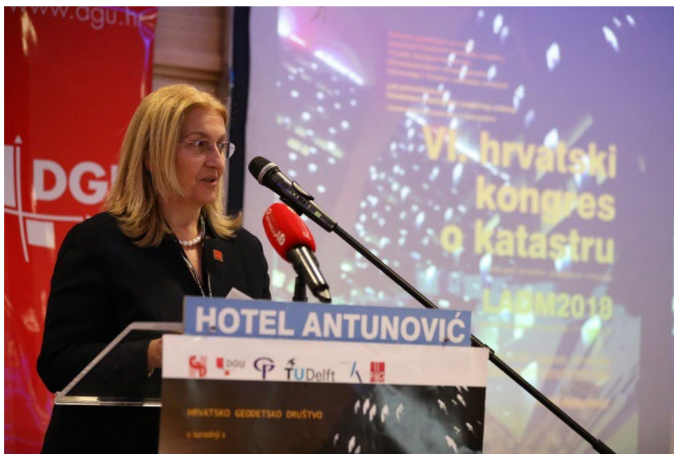
Slika 3. Predsjednica FIG-a Chryssy Potsiou pozdravlja okupljene.