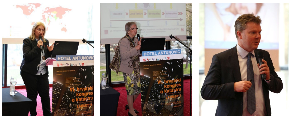
Slika 6. Predsjednica FIG-a Chryssy Potsiou (lijevo), predsjednica FIG komisije 7 Gerda Schennach (sredina) i direktor Nizozemskog katastra International Kees de Zeeuw (desno) drže svoja pozvana predavanja.