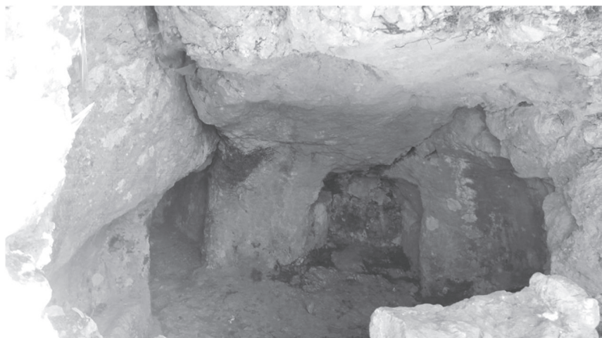
Figure 3. Interior of the Dervish Cave in Bioča (private photo library of the author of the work)