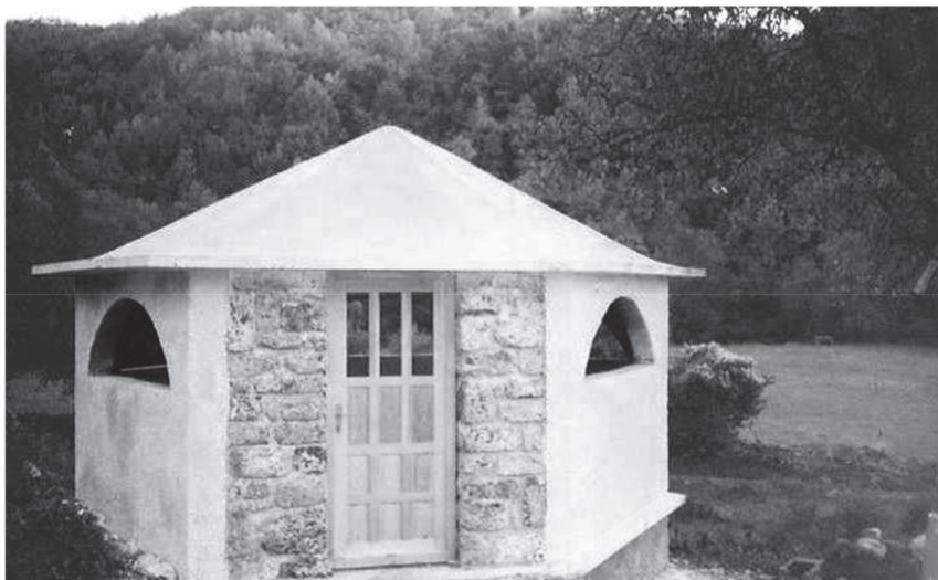
Figure 4. Turbeta in Paljuh (B. Agović. Turbeta and clock towers in Montenegro ).

The period in which the Bektashis in general, even in Bihor, had to live under changed circumstances compared to the time before 1826, lasted until 1852, when a decree re-established the office of the head of the Bektashi tekke in Constantinople (BOA,