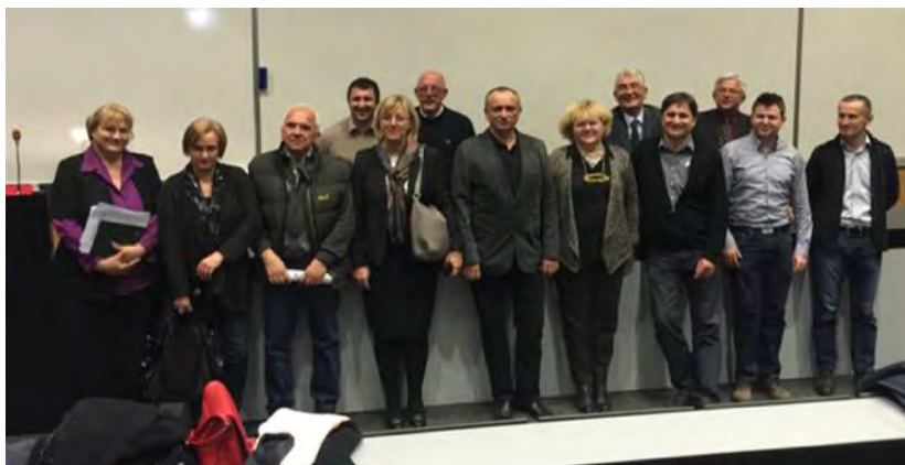
Slika 1. Novo predsjedništvo Zagrebačke udruge geodeta.