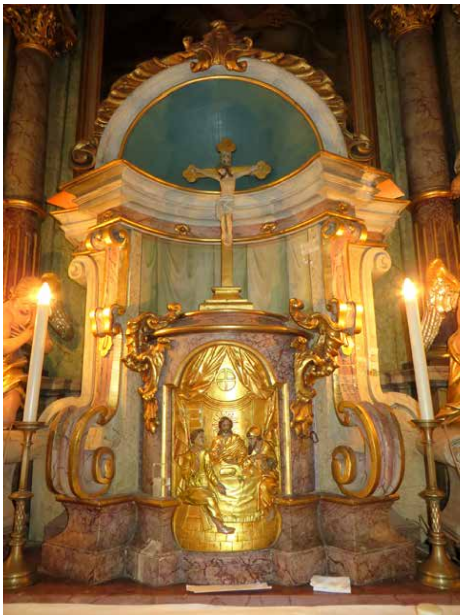
7. Gregoričev tabernakul, danas na glavnom oltaru župne crkve sv. Marije Magdalene u Bebrini