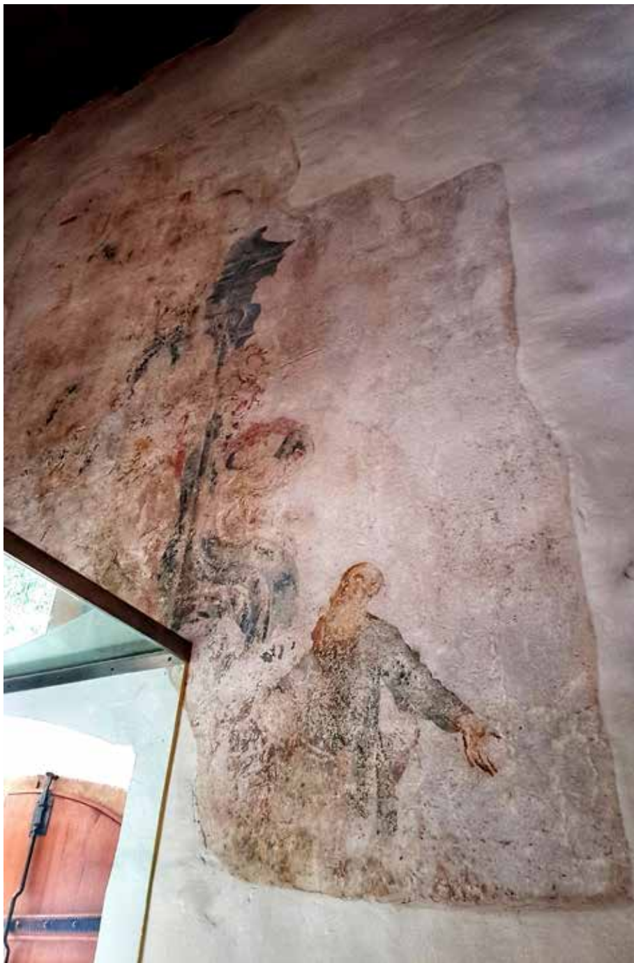
3. Zidni oslik s prikazom „Navještenja“