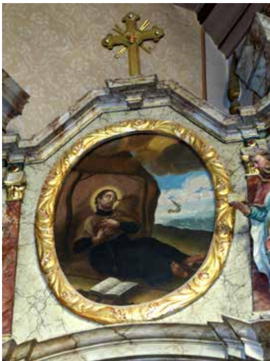
11. Prikaz smrti sv. Franje Ksaverskog s oltarne pale naatici oltara sv. Franje Ksaverskog, danas Gospe Lurdske u župnoj crkvi sv. Marije Magdalene u Bebrini