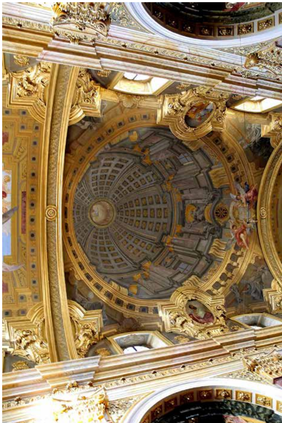
2. Iluzionistička kupola Andree Pozza u isusovačkoj crkvi u Beču koja je poslužila kao inspiracija za iluzionističku kupolu požeških isusovaca u crkvi sv. Lovre