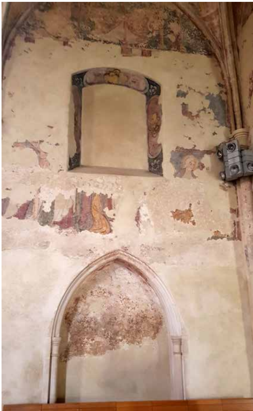
1. Barokni oslik prozora na južnom zidu svetišta