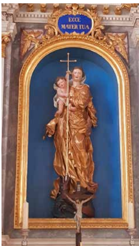
14. Thallerova Gospa