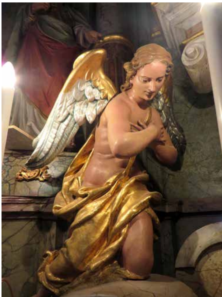
8. Anđeli adoranti uz Gregorićev tabernakul, danas na oltaru župne crkve Marije Magdalene u Bebrini