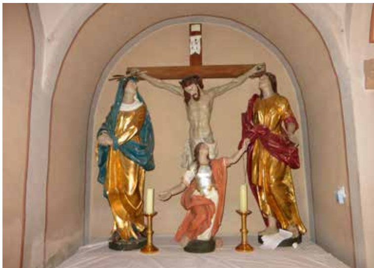
13. Skulpturalna skupina oltara sv. Križa, danas u župnoj crkvi sv. Marije Magdalene u Bebrini