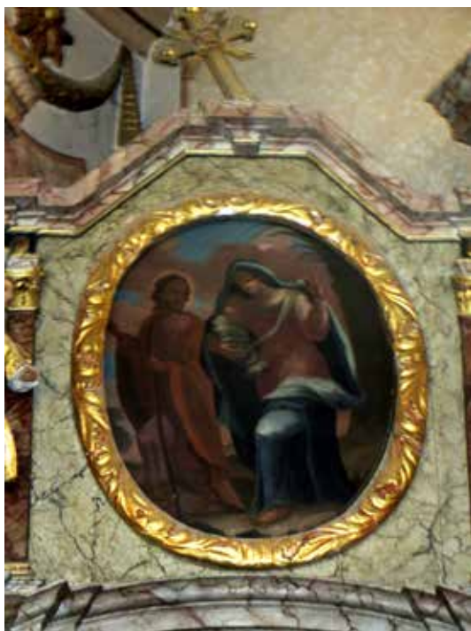
12. Bijeg u Egipat s atike oltara sv. Josipa, danas u župnoj crkvi sv. Marije Magdalene u Bebrini