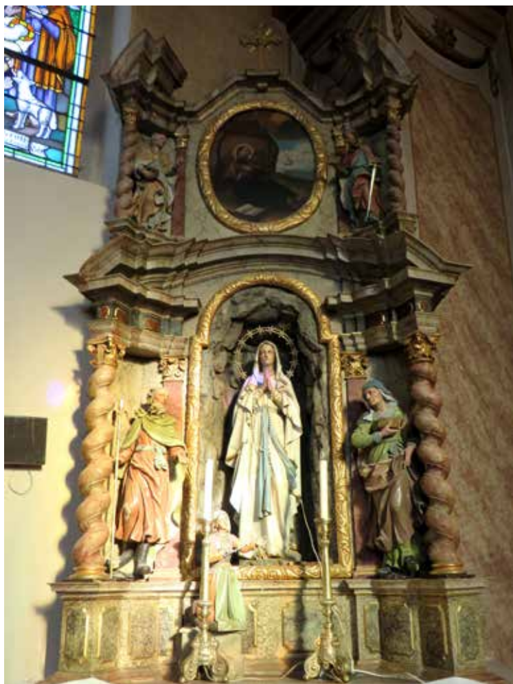
10. Oltar Franje Ksaverskog, danas oltar Gospe Lurdske župne crkve sv. Marije Magdalene u Bebrini