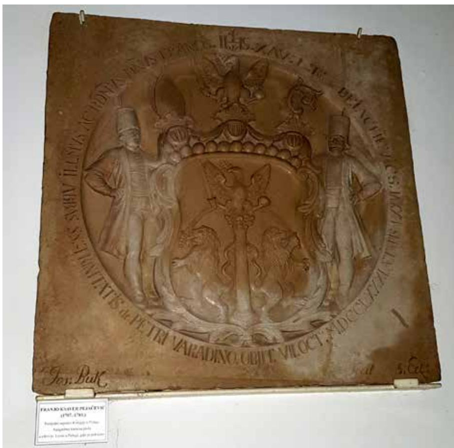
4. Nadgrobná ploča Pejačevića