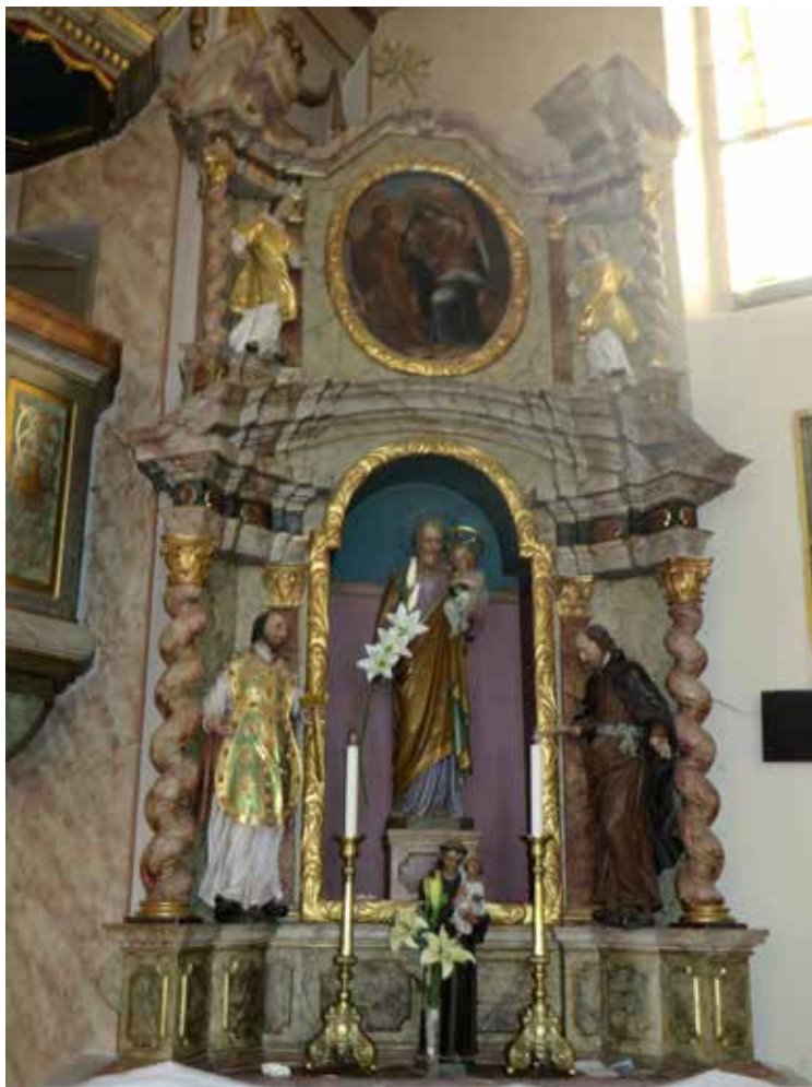
9. Oltar sv. Josipa, danas bočni oltar crkve sv. Marije Magdalene u Bebrini