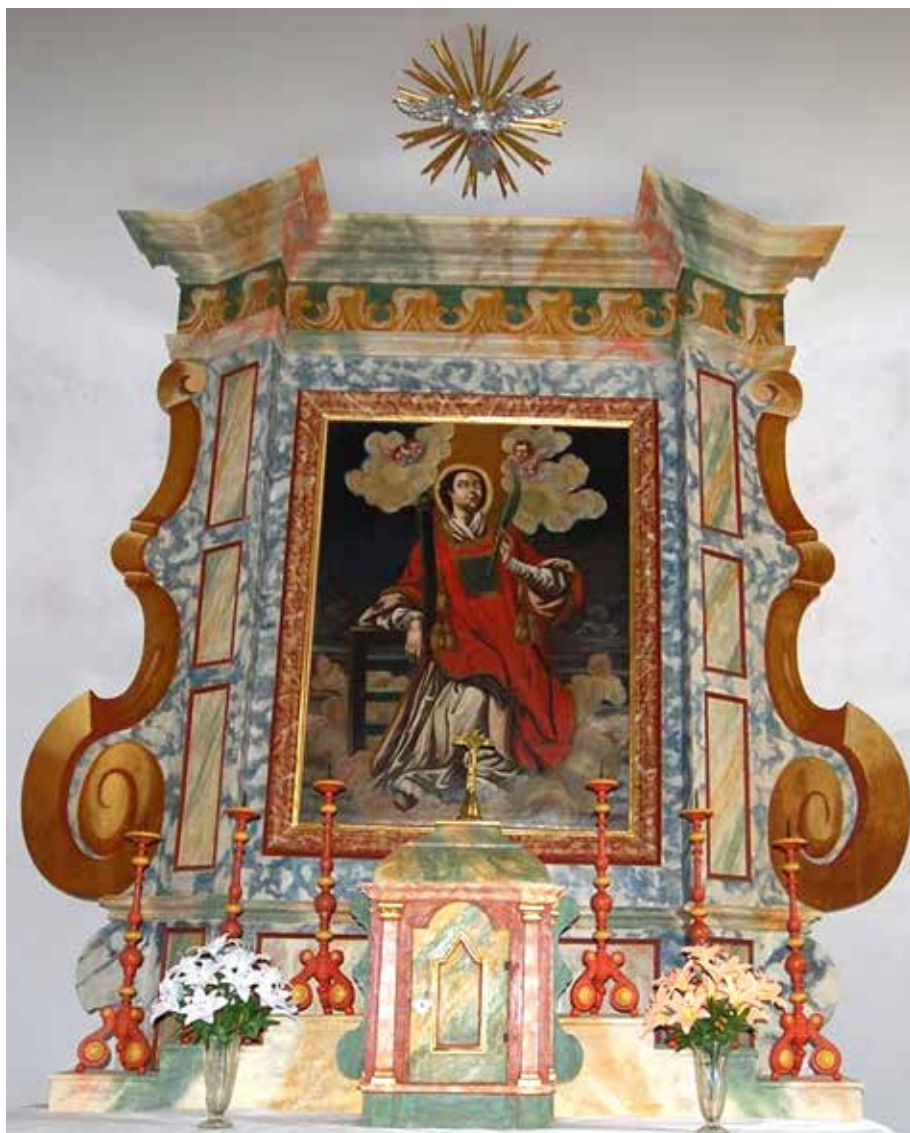
6. Oltarna pala sv. Lovre u crkvi sv. Lovre u Crkvarima (foto Žarko Španiček, 17. svibnja 2010.)