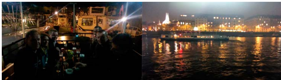
Slika 3. Noćna vožnja brodom po rijeci Vltavi.

Osim prisustvovanja stručnom dijelu konferencije, djelatnici fakulteta uživali su i u ljepotama Praga danju i noću, gdje treba izdvojiti i noćnu vožnju brodom po rijeci Vltavi (slika 3) i posjet regionalnom podzemnom istraživačkom centru Štola Josef (prije rudnik zlata) uda-