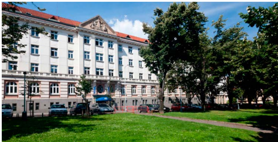
Slika 1. Hotel “Masarykova kolej”.

U Pragu je od 3. do 4. travnja 2014. održana VI. Međunarodna konferencija o Inženjerskoj geodeziji. Konferencija je održana u kongresnoj sali hotela “Masarykova kolej” (slika 1). Organizatori konferencije bili su Zavod za Geodeziju Građevinskog fakulteta Slovačkog Tehničkog Sveučilišta u Bratislavi i Građevinski fakultet Češkog Tehničkog Sveučilišta u Pragu, u suradnji s FIG-ovom Komisijom 6. Službeni jezik konferencije bio je engleski.