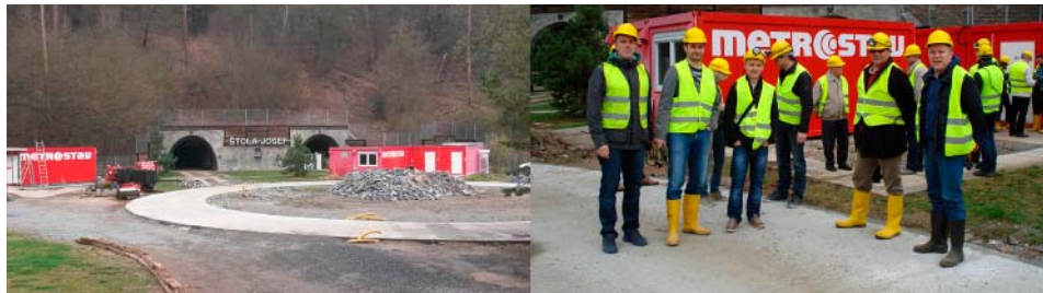
Slika 4. Podzemni istraživački centar Štola Josef.

ljenom 50 km od Praga (slika 4). Posjet Češkoj završio je jednodnevnom posjetom Češkim Budojevicama i Češkom Krumlovu, gradu čije je povijesno središte 1992. godine upisano na UNESCO-v popis mjesta svjetske baštine u Europi (slika 5).