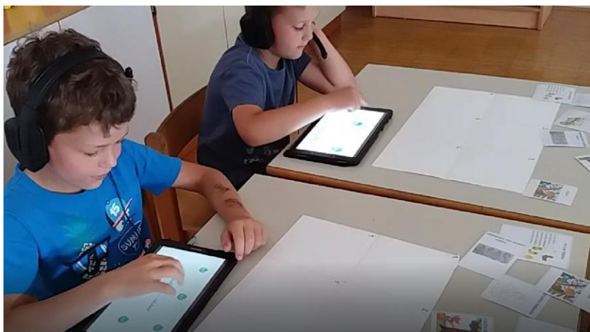
Slika 3: Korištenje tableta u nastavi.

Djeca jako vole rješavati zadatke na tabletima. Često imamo zadatak u kojem koristimo informacijsku i komunikacijsku tehnologiju (ICT) (Slika 3).