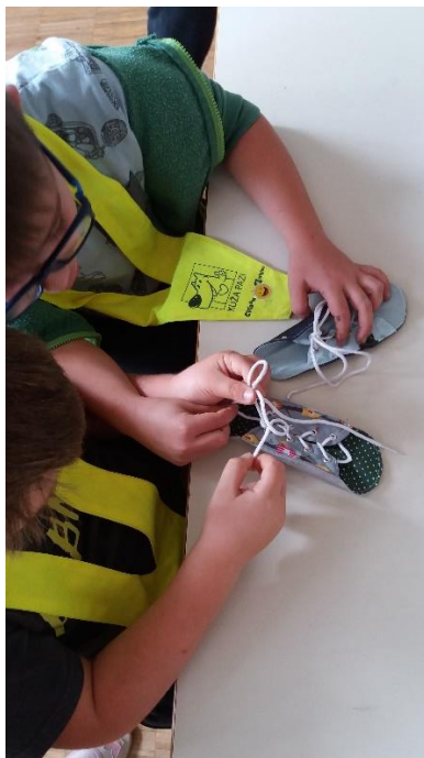
Slika 1: Razvijanje fine motorike. Učenik uči drugog učenika kako vezati vezice.

Dijete bira redoslijed kojim će izvršavati obvezne zadatke. Naravno, mora paziti na maksimalan broj djece za svaki zadatak. Kod obveznih zadataka postoji znak - miš i lista na kojoj je dijete označeno kada izvrši zadatak, tako da i učitelj ima pregled koja su djeca već riješila određeni zadatak, a koja nisu (slika 2). Po potrebi može usmjeravati i pomagati djeci kojima je potrebna pomoć u organizaciji.