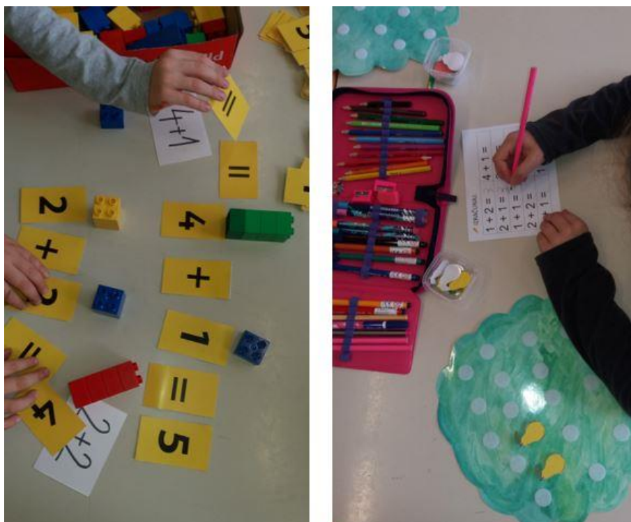
Slika 4: Rad s didaktičkim materijalom.

U navedenoj metodi rada, djeca imaju puno praktičnog rada – s didaktičkim materijalom (slika 4).