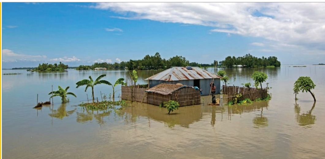
Sl. 2. Ostaci nekadašnjeg obalnog naselja negdje u Bangladešu, nastradali zbog porasta razine mora.

u ljetnoj odjeći dulje od 5 minuta. Slično tome, Sunce nam neprestano šalje enormne količine svoje energije, koja u dodiru sa Zemljom obavi izvjesni rad (fizika!) te se potom pretvori u toplinu (infracrveno zračenje), koja sada služi kao nečija nutritivno kvalitetna hrana. Naime, molekule \text{CO}_2 u zraku su svojevrсни sportaši, koji baš tu toplinu trebaju za svoje svakodnevne aktivnosti (rotacije, vibracije, itd.) te će poput sportaša isijavati toplinu natrag prema Zemlji. Tim procesom dolazi do pojačanog učinka staklenika i energijske neravnoteže, što za sobom povlači cijeli niz problema (npr. porast morske razine) s kojima se suočava uglavnom veći dio stanovništva na Zemlji nastanjen u siromašnim državama i onima u razvoju, ponajviše u priobalnim regijama (sl. 2). Opisani proces je prirodni proces učinka staklenika. Do neravnoteže dolazi dodatnom emisijom \text{CO}_2 i ostalih stakleničkih plinova što je posljedica aktivnosti čovjeka, odnosno spaljivanja fosilnih goriva.