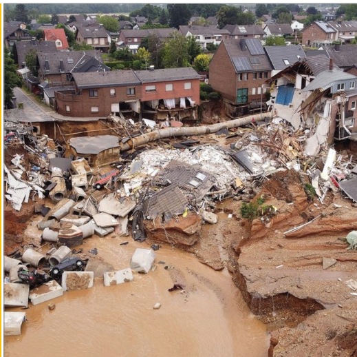
Sl. 1. Šteta od poplava (srpanj 2021.) u gradu Erftstadtu, jugozapadno od Kölna, u saveznoj državi Sjeverna Rajna-Vestfalija u zapadnoj Njemačkoj.