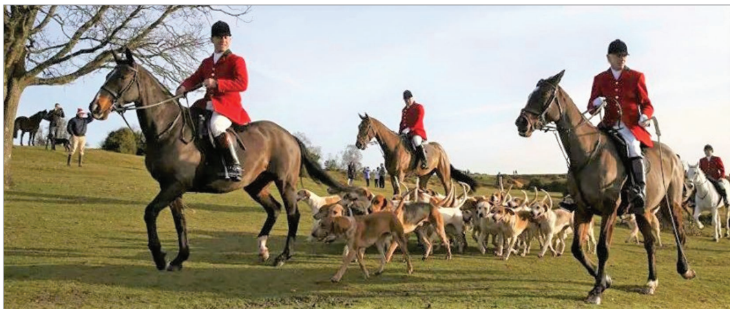
Sl. 2. Grupni lov na lisice s psima

Povod ruralnom konfliktu krajem 1990-ih koji je zadobio velik broj sudionika te popunio novinske stranice i promijenio način na koji javnost percipira ruralni prostor bio je političke naravi. Naime 1997. godine došlo je do promjene vladajuće stranke u Ujedinjenom Kraljevstvu te je nakon gotovo 20 godina vlasti Konzervativne stranke na vlast bila izabrana stranka lijevog centra odnosno Laburistička stranka. Laburistička vlada planirala je donijeti zakon o zabrani lova s psima na lisice što je snažno odjeknulo u ruralnom prostoru Ujedinjenog Kraljevstva te uzrokovalo val masovnih protesta koji su trajali od 1997. do 2002. godine te pretvorili „apolitički ruralni prostor“ upravo u centar političkih previranja i nemira što se dakako odrazilo i na javnu percepciju tog prostora.