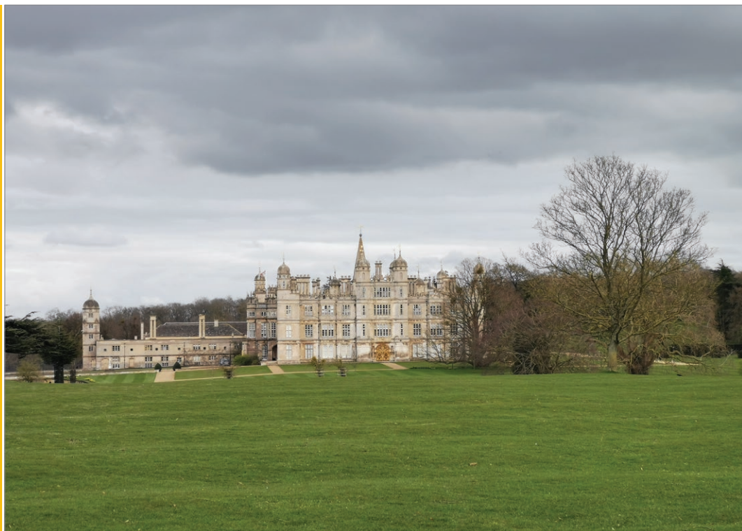
Sl. 1. Primjer britanskog ruralnog krajolika – Burghley House, Stamford, Lincolnshire