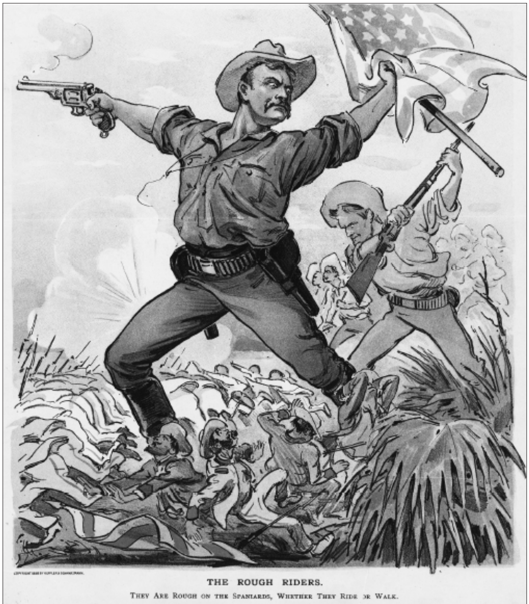
Slika 4. Karikaturni prikaz bitke na San Juanu u časopisu Puck. Ispod ilustracije prevedno piše: „Surovi jahači. Surovi su prema Španjalcima, jašući ili hodajući.“