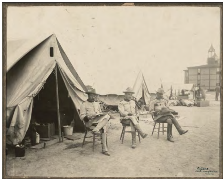
Slika 1. S lijeva na desno: Roosevelt, Wood i vojnik Alexandar Brodie (treći po zapovjednoj liniji) u San Antoniju

Rooseveltu je vojni svijet bio relativna novost. Jedino prijašnje vojno iskustvo imao je 1882. kada se pridružio Nacionalnoj gardi savezne države New York gdje je dogurao do čina satnika, ali se garda većim dijelom bavila samo vojnim vježbama. 37 Zbog toga nije neobično to što je često činio protokolarne greške. Tako je jednog popodneva odveo dio dobrovoljaca u krčmu gdje im je na svoj račun platio pića koliko su htjeli. Kada je čuo za to, iste večeri pukovnik Wood svojim je časnicima održao kratki govor kojim je upozorio kako „zapovjednik koji bi odveo van veliku grupu ljudi i pio s njima, nije dostojan časničkog čina“. 38 Roosevelt nije bio izravno imenovan, ali se istog dana u osobnom razgovoru s Woodom ispričao. Nakon gotovo dva tjedna daljnjih priprema, 27. svibnja, u kamp stiže zapovijed iz Washingtona – cijela brigada mora se premjestiti u Tampu na Floridi kako bi se pripremili za skori ukrcaj prema Kubi. Dobivši zapovijed da napuste San Antonio, Wood i Roosevelt grlili su se kao „školarci“. 39 U rano jutro 30. svibnja konvoj Surovih jahača konačno je napustio San Antonio i vlakovima se uputio prema Floridi.