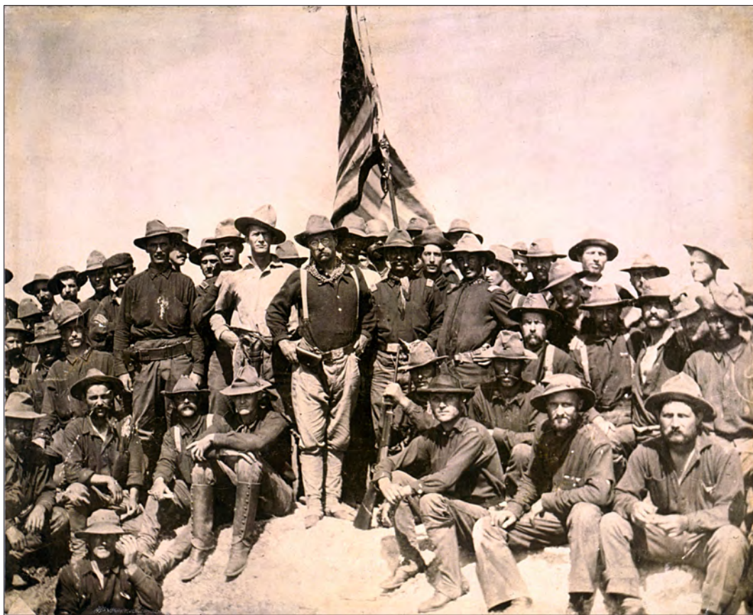
Slika 2. Surovi jahači (sa Rooseveltom u sredini) na vrhu brda San Juan

Porazu španjolskih četa pridonijela je loša raspoređenost vojske oko prilaza Santiagu. Brdo Kettle branilo je svega 137 vojnika, a San Juan 521. Ostatak od oko 5000 vojnika bio je na sjevernim i zapadnim prilazima gradu ili u rezervi. 67 Unatoč visinskoj prednosti, s takvim brojevima, jednostavno nisu imali šanse protiv čak 7000 američkih vojnika. Uvečer, američke snage gledale su ispred sebe Santiago, ali i posljedice koje je donijela bitka. Nakon onoga što su proživjeli taj dan, Roosevelt je bio uvjeren da su njegovi momci spremni na sve: „Osjećao sam potpuno povjerenje u njima i bio bih više nego spreman staviti ih pod bilo koji zadatak, doma ili u inozemstvu, koji bi svaka iskusna pukovnija u svijetu mogla izvršiti.“ 68 U bitci za San Juan, Surovi jahači dali su 15 života, a 72 osobe pretrpjele su ozljede. 69