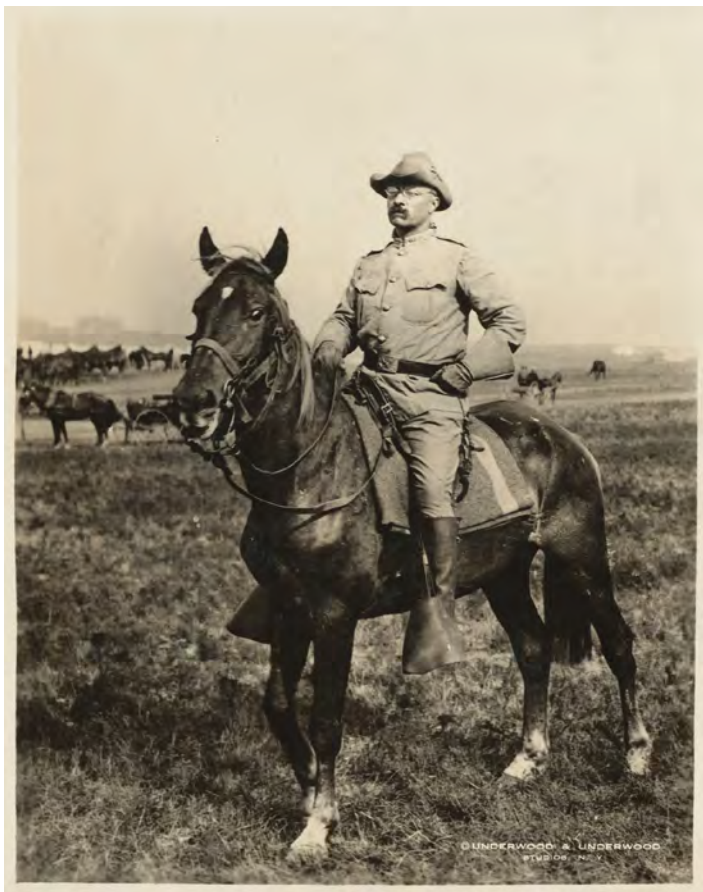
Slika 5. Roosevelt u kampu Wilkoff, Montauk

Što se tiče vojnih odlikovanja, Roosevelt nije bio među 28 sudionika rata koji su 1899. dobili Medalju časti. Pravi razlog njegova izostanka s liste nagrađenih teško je izdvojiti. Onaj najočitiiji – njegova prepirka s ministrom rata – vjerojatno nije bio presudan. Dapače, pisma iz ministarstva rata upućena Rooseveltu pokazuju njihovu volju da mu pomognu dobiti to priznanje. 93 Roosevelt se svejedno osjećao uskraćeno, smatrao je da je zaslužio tu prestižnu nagradu. Tek početkom 2001.,