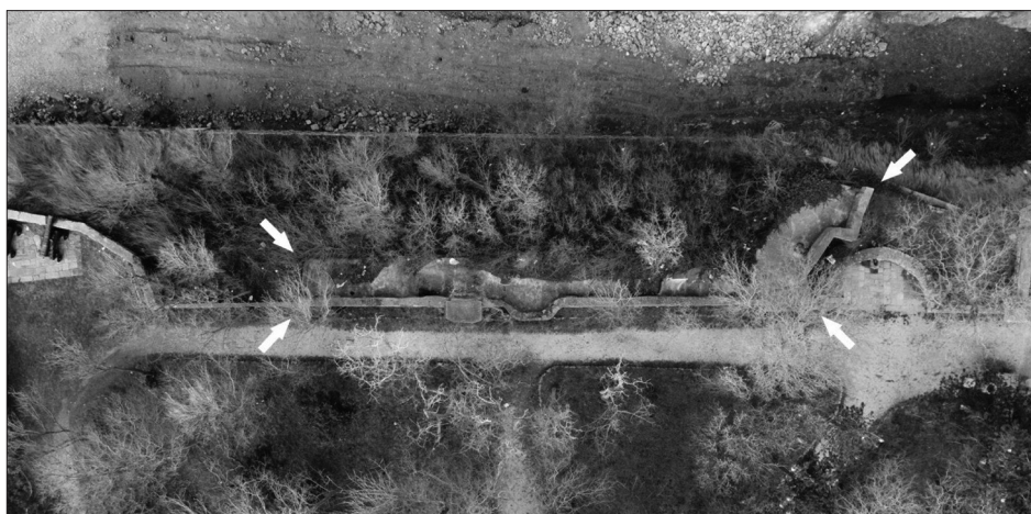
Sl. 2. Zračna fotografija rova

označavaju godinu gradnje objekta, a praznina ispod možda je ostavljena tekstu koji iz nepoznatog razloga nikada nije ni bio ispisan (Sl. 5). Pokrov rova izveden je u obliku masivne armirane betonske ploče koja se spušta prema otvorima puškarnica koji su na pravilnim razdaljinama raspoređeni duž sjeverne strane, no zbog zemlje koja je prekrila otvore i guste vegetacije i raslinja nije moguće sa sigurnošću utvrditi njihov broj. Raspored šarki ukazuje da su originalno bile