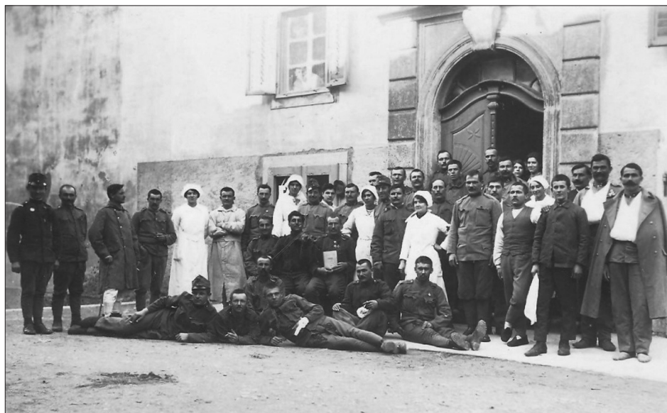
Sl. 7. Vojnici s osobljem bolnice Crvenog križa ispred ulaza u zgradu "Verein"

su takve objekte koristili nameću se pučko-ustaška zapovjedništva koja su, kao trećelinjske postrojbe, okupljala rezerviste domobranskih jedinica, odslužene vojnike starijih godišta i vojnike mlađih godišta bez završenog vojnog roka. Ustrojavala su se proglašenjem opće mobilizacije i isključivo su djelovale na prostoru ozemlja gdje im je temeljna zadaća bila osiguranje komunikacija i važnijih objekata. Između 1914. i 1918. nosila su oznake pripadajućih domobranskih pukovnija, a Kotar Senj pripadao je pod pučko-ustaško zapovjedništvo u Karlovcu i popunjavao je 26. pučko-ustašku pukovnicu. 33