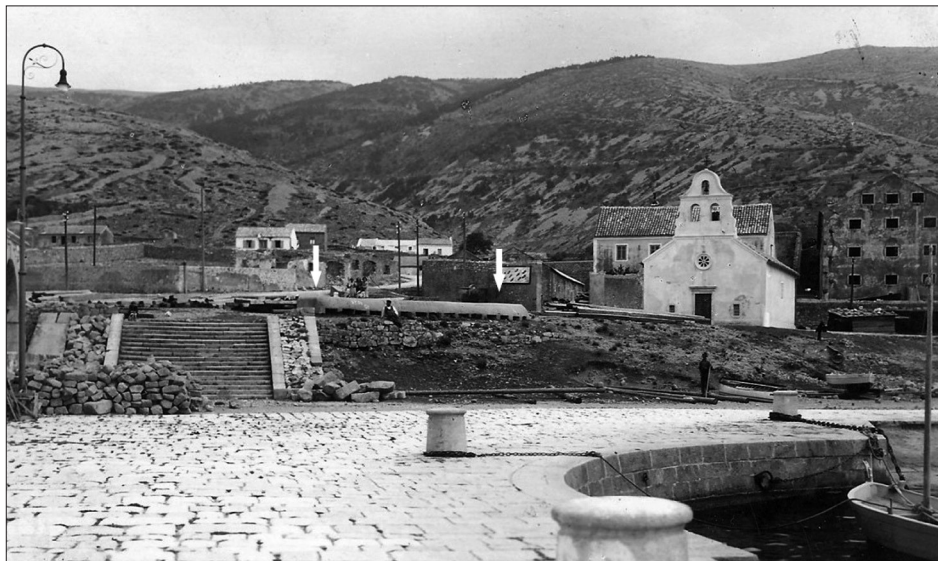
Sl. 6. Gradski predjel Sv. Ambroz s označenim položajem austrougarskog rova

radova na proširenju igrališta 70-ih godina prošlog stoljeća, pronađeno mnoštvo različitih nalaza vojne opreme i naoružanja iz razdoblja početka 20. stoljeća, koji se, po svoj prilici, mogu dovesti u vezu s aktivnostima austrougarske vojske. 21 Moguće je pretpostaviti da su rovovi na "tenisu" bili izgrađeni na sličan način kao oni u Parku senjskih književnika i oni iznad gata sv. Ambroza, a pri njihovoj gradnji najvjerojatnije je korišten sivi vapnenački kamen dostupan nadohvat ruke, a eksploatiran na mjestu samog "tenis-igrališta" koje se smjestilo unutar depresije stare "kave", odnosno kamenoloma. 22