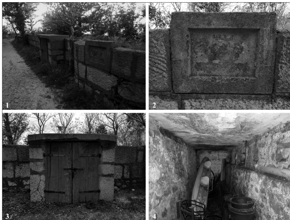
Sl. 5. Austrougarski rov u Parku senjskih književnika – 1) pogled na vanjsko lice kod zapadnog ulaza, 2) ploča s 1916. godinom, 3) zapadni ulaz, 4) unutrašnjost rova

postavljene vjerojatno tipske kovane vratnice. U unutrašnjost rova spušta se stepenicama, a podno otvora puškarnica na sjevernoj strani u cijeloj dužini pruža se betonska klupa ( fire step ) koja omogućuje dostizanje položaja za ciljanje i otvaranje vatre kroz otvore (Prilog 1). Niz otvora na bočnim zidovima objekta svjedoči da je betonsku ploču s unutrašnje strane izvorno podupirala drvena konstrukcija s daskama i poprečnim gredama koja je u međuvremenu propala. Komunikacija unutar rova i između dva ulaza nije moguća zbog recentne gradnje pregradnog zida. K tome, rov je danas zakrčen različitim predmetima i komunalnom opremom koja služi za održavanje parka. Tragovi degradacije opažaju se na vanjskoj strani gdje je kameno pročelje na nekoliko mjesta išarano grafitima, a na ulazima je postavljena deplasirana plastična stolarija.