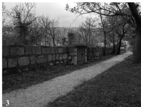
Sl. 4. (1-3) Pogledi iz Parka na pročelje rova