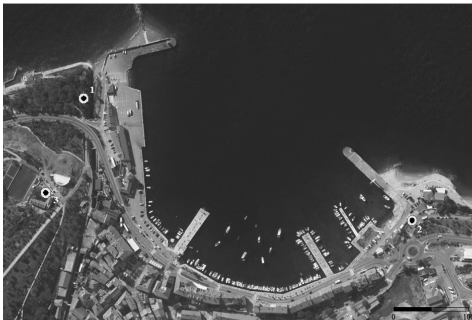
Karta 1. Položaji austrougarskih fortifikacija: 1. Park senjskih književnika, 2. Sveti Ambroz, 3. "Tenis-igralište" na brdu Nehaj

u druge svrhe. 13 Dinamičnom preobrazbom grada koji formalno prestaje biti "utvrda" gradnja fortifikacija privremeno je utihnula sve do razdoblja globalnih sukoba koji će uslijediti kroz pola stoljeća kasnije i ostaviti traga u brojnim primjerima vojne arhitekture. Usprkos činjenici da srednjovjekovne i ranonovovjekovne fortifikacije pobuđuju zanimanje stručnjaka, daleko je lošije stanje istraženosti fortifikacija iz ratova 20. stoljeća o kojima se vrlo malo zna. 14 Uz brojne podzemne i nadzemne položaje iz Drugog svjetskog rata relativno je nepoznat podatak da senjskoj fortifikacijskoj baštini pripadaju i pojedini objekti koji nastaju u razdoblju Prvog svjetskog rata, odnosno mogu se povezati s aktivnostima austrougarske vojske koja tijekom prvih ratnih godina gradi vojne rovove na nekoliko položaja na periferiji luke i u blizini središta grada: u današnjem Parku senjskih književnika (ili parku "Art"), na predjelu Sv. Ambroz te na položaju "tenis-igrališta" na zapadnim obroncima brda Nehaj (Karta 1).