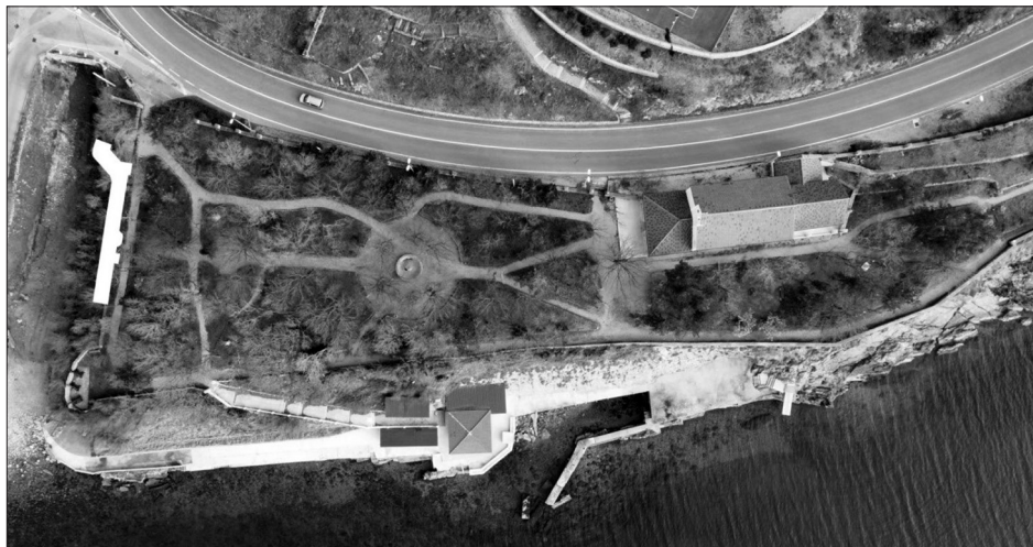
Sl. 1. Položaj rova u Parku senjskih književnika