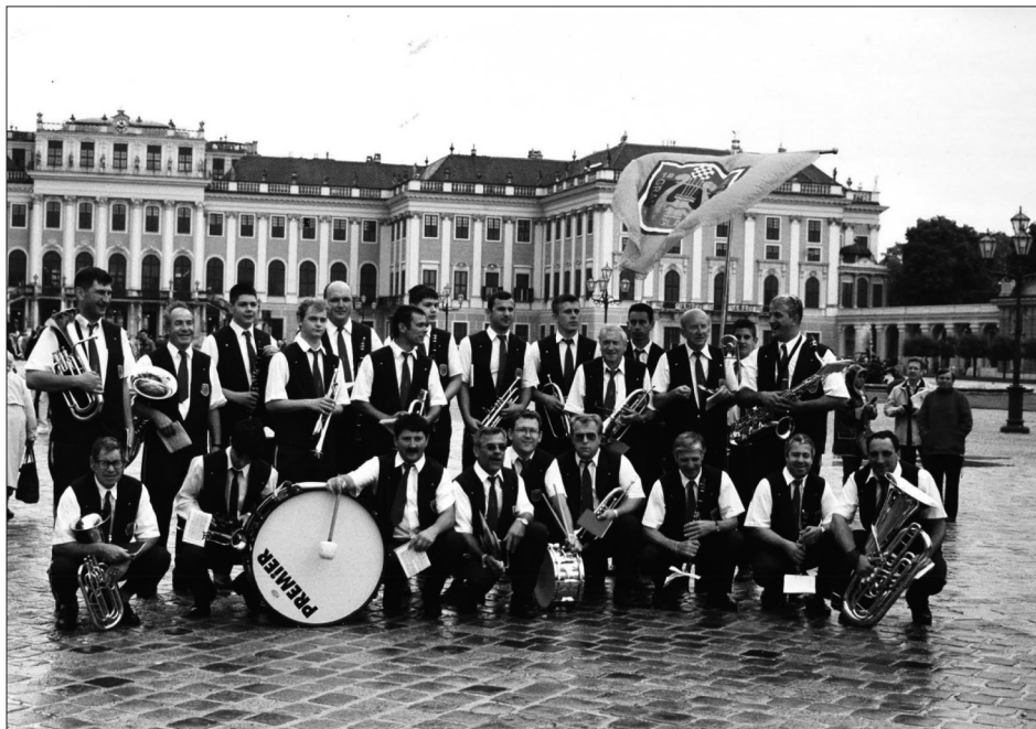
Sl. 5. Gradska glazba Senj 8. lipnja 2002. godine u Beču

rata bilo je izuzetno teško ponovno pokrenuti rad gradske glazbe, posebice pronaći nove prostorije, glazbala i instrumente te okupiti glazbenike. 28 Međutim, glazbenici su se ponovno okupili na čelu s Franom Bašićem i Marinom Nellom, a čak su pedesetih godina 20. stoljeća prosječno imali 21 glazbenika. 29 Razlog pada broja glazbenika od 60-ih do 80-ih godina 20. stoljeća može se pronaći i u svojevrsnom prirodnom ciklusu generacija unutar gradske glazbe; tada se gradska glazba pomlađuje jer se na fotografijama iz 80-ih i 90-ih može pronaći velik broj mladih glazbenika koji su tek postali članovi gradske glazbe, a sve manje starijih glazbenika. Stariji glazbenici sigurno su pomogli pri toj tranziciji jer upravo oni uče svirati nove glazbenike pa tako i dalje sudjeluju u radu gradske glazbe. Uz sve navedeno, na stagnaciju je utjecala i smrt dugogodišnjeg predsjednika i kapelnika Martina Nella 1953. godine koji je vodio gradsku glazbu od 1928. godine kroz vrlo burno i vrtoglavo razdoblje. 30