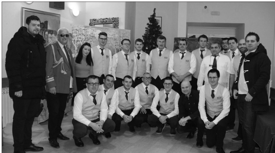
Sl. 6. Zadnji (božićno-novogodišnji) koncert Gradske glazbe Senj 29. prosinca 2019. godine

Odluci o nužnim epidemiološkim mjerama kojima se ograničavaju okupljanja i uvode druge nužne epidemiološke mjere i preporuke radi sprječavanja prijenosa bolesti COVID-19 putem okupljanja zabranjeno je "održavanje amaterskih kulturno-umjetničkih izvedbi, programa i manifestacija ako nisu zadovoljeni posebni uvjeti". 36 Odnosno, kulturni sadržaj je dopušten uz "strogo pridržavanje propisanih epidemioloških mjera i posebnih preporuka i uputa Hrvatskog zavoda za javno zdravstvo, s time da je za održavanje izvedbi, programa i manifestacija u zatvorenim prostorima uvjet da svi prisutni (izvođači, gledatelji i dr.) posjeduju EU digitalne COVID potvrde". 37 Zbog svega navedenog gradska glazba nije održavala koncerte od početka pandemije, ali je velik problem i nemogućnost održavanja probi u sadašnjim prostorijama gradske glazbe jer je nemoguće održavati fizičku udaljenost glazbenika. 38 Ipak, s popuštanjem mjera glazbenici su se 2022. godine okupili i ponovno zasvirali na otvaranju 49. Međunarodnog ljetnog karnevala i u karnevalskoj povorci.