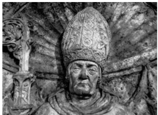
Replika Slatkonjinog nadgrobnog kamena (iz Beča) u Novom Mestu (2022).