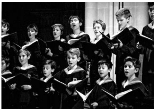
Zbor Bečkih dječaka/Wiener Sängerknaben danas.

Dok je obnašao dužnost biskupa, Slatkonja se borio s brojnim nedaćama. U zadnje tri godine gubio je snagu te je dobio koadjutora, što znači pomoćnika ili