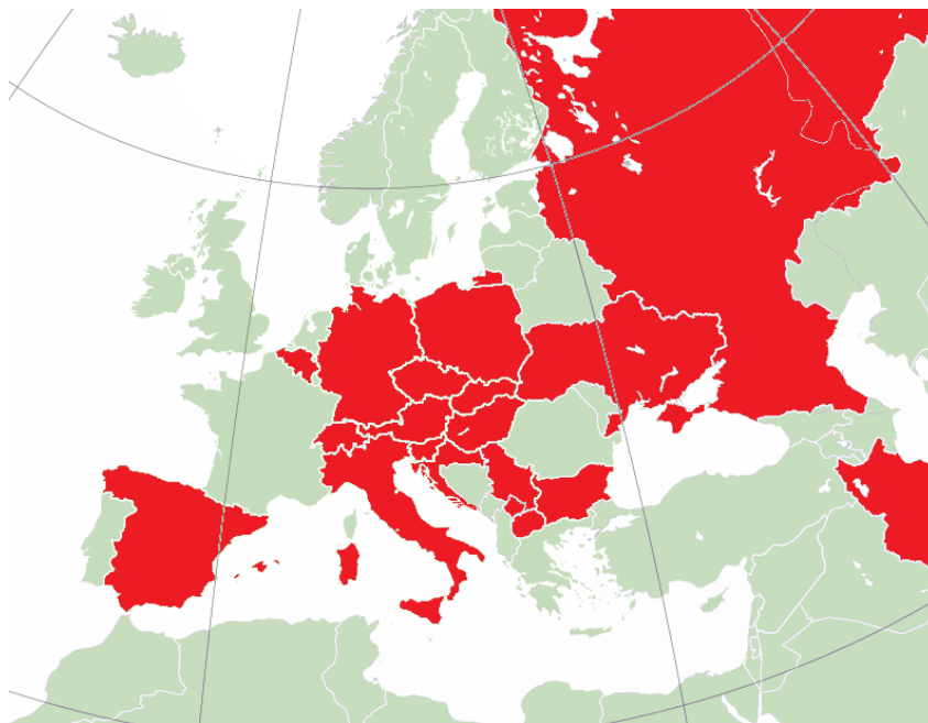
Zemljovid 1. Države iz kojih su autori znanstvenih i stručnih radova objavljenih u časopisu Folia onomastica Croatica (obojeno crveno)

U tridesetogodišnjem razdoblju 1992. – 2022. najveći broj autora znanstvenih i stručnih radova (njih 77 %) objavljenih u časopisu Folia onomastica Croatica radio je i/ili živio u Hrvatskoj, sukladno očekivanjima, a čak 99,71 % autora bilo je iz europskih država. Godine 2022. u časopisu je prvi put objavljen i rad autora s azijskoga kontinenta, što pokazuje sve veću afirmaciju časopisa među onomastičarima diljem svijeta.