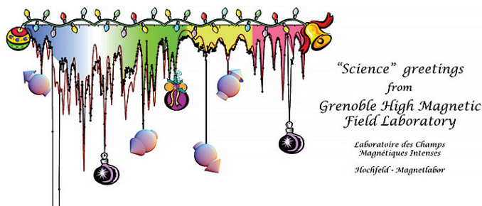
Slika 5. NMR spektar kojim je potvrđeno postojanje “magnetskog kristala” ovdje je okrenut naopako i ukrašen da bi postao novogodišnjom čestitkom laboratorija.

Naravno, od znanstvenih doprinosa su mi više prirasli srcu oni gdje sam se ponajviše sam potrudio za njihovo ostvarenje. Radi se o mojoj glavnoj znanstvenoj tematici kvantnog magnetizma, gdje jako magnetsko polje može inducirati posebna, egzotična stanja materije. Jedan primjer je Bose-Einsteinov kondenzat koji je magnetski ekvivalent električnom supravodljivom stanju. Drugi primjer su platoi u krivulji magnetizacije u ovisnosti o magnetskom polju, koji u posebnim slučajevima mogu odgovarati uređenju lokalne raspodjele magnetizacije u magnetski kristal (tzv. Wignerovom kristalizacijom). Teorijski je prvi put predloženo da se upravo to događa u spoju \text{SrCu}_2(\text{BO}_3)_2 , a naša NMR mjerenja su dala prvi i jedini dokaz te pretpostavke, kao i detaljnu informaciju o strukturi tog magnetskog kristala (vidi slike 4 i 5).