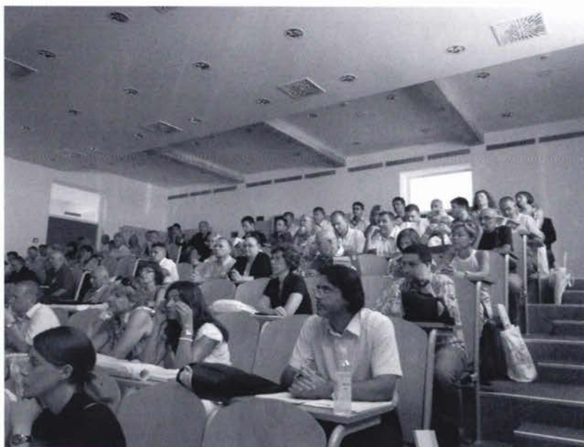
Slika 2. Sudionici 3. hrvatskog NIPP i INSPIRE dana i 7. savjetovanja Kartografija i geoinformacije.