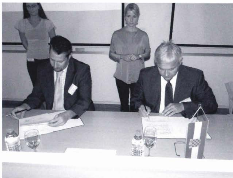
Slika 3. Potpisivanje Sporazuma o razmjeni kartografskog materijala između Instituta za geodeziju, kartografiju i daljinska istraživanja Republike Mađarske i DGU.