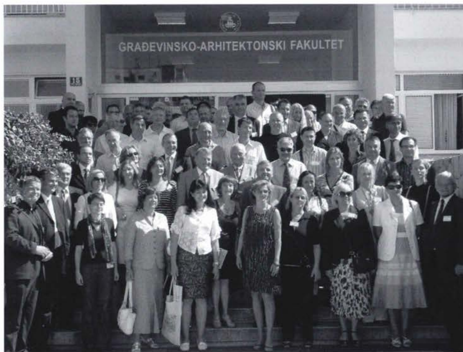
Slika 1. Sudionici 3. hrvatskog NIPP i INSPIRE dana i 7. savjetovanja Kartografija i geoinformacije.

Program i sažeci radova 3. hrvatskog NIPP i INSPIRE dana i 7. savjetovanja Kartografija i geoinformacije objavljeni su dvojezično (hrvatski i engleski) u formatu A4 na 96 stranica. Osim toga svi sudionici konferencije dobili su u vrećici s otisnutom vedutom Splita obilje propagandnog materijala sponzora te karte i turističke vodiče grada Splita i srednje Dalmacije.