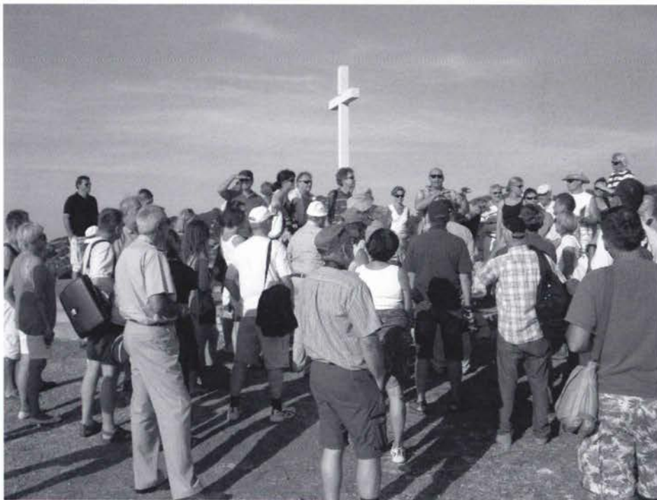
Slika 5. Posjet spomeniku RAF s pogledom na Viško polje.

Nakon posjeta austrijske utvrde Gospina batarija i muzeja Grada Visa slijedio je ručak u predjelu grada Visa poznatom pod nazivom Kut. Nakon ručka izlet je nastavljen vožnjom prema središnjem dijelu otoka gdje smo posjetili spomenik RAF-u s pogledom na Viško polje na kojem je tijekom II. svjetskog rata bila zračna luka. Vožnja je nastavljena prema Komiži uz posjet crkvi sv. Nikole. Komiža je naselje mlađeg postanka od susjednog grada Visa. Prvi put se spominje 1145. godine kao Val Comeza u darovnici zadarskog kneza Petra, koji je