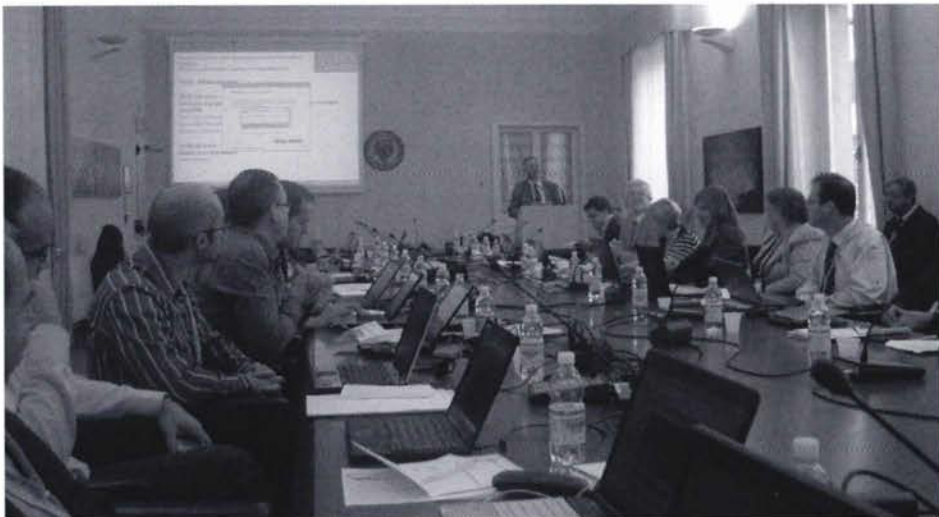
Slika 1. Sudionici EuroSDR skupa.