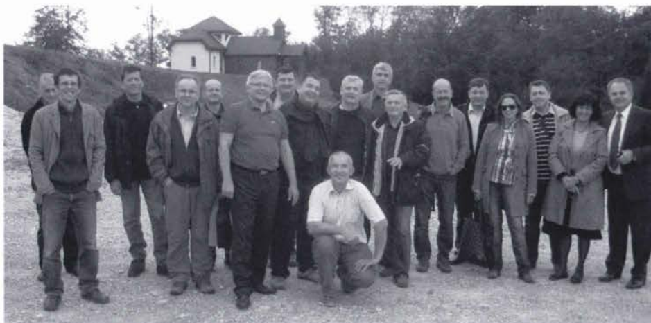
Slika 1. Susret geodeta Državne geodetske uprave Republike Hrvatske i Geodetske uprave Republike Slovenije.