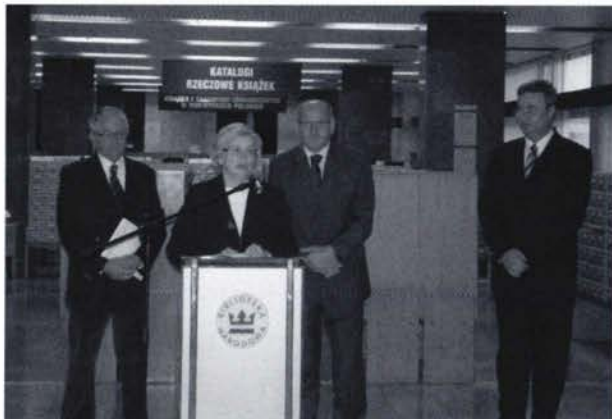
Slika 1. Otvorenje izložbe pod nazivom Hrvatska na starim i novim kartama u Narodnoj biblioteci u Varšavi.

Dana 6. listopada 2011. godine otvorena je izložba pod nazivom Hrvatska na starim i novim kartama u Narodnoj biblioteci u Varšavi (slika 1). Izložba se sastoji od starih i novih karata koje su donirale Državna geodetska uprava, Hrvatski hidrografski institut i Gradski ured za katastar i geodetske poslove Grada Zagreba (slika 2).