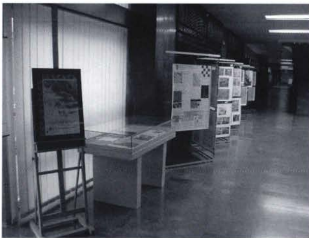
Slika 2. Postav izložbe.