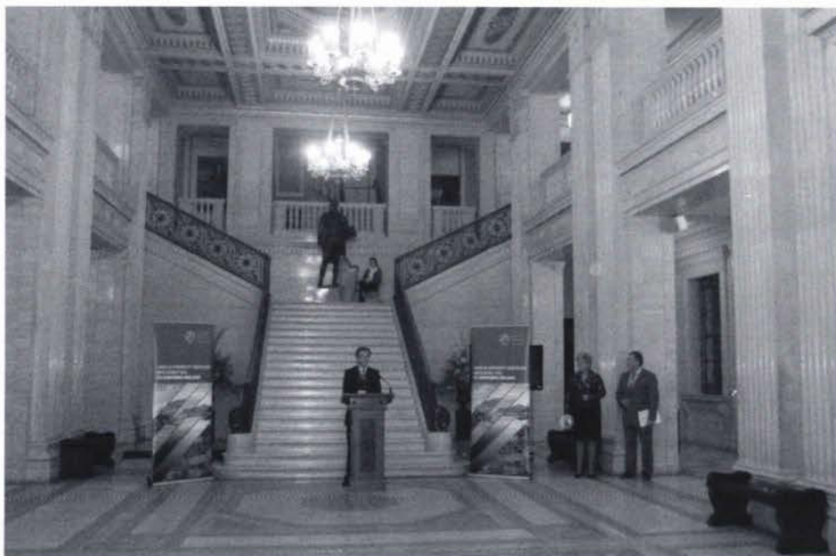
Slika 1. Otvaranje 11. generalne skupštine EuroGeographicsa.