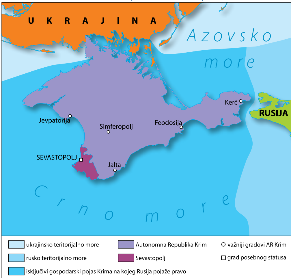
Slika 1. Prikaz spornog područja Autonomne Republike Krim i Sevastopolja (imenovane kao ukrajinske administrativne jedinice)

Izvori: autori prema Flanders Marine Institute (2019), Humanitarian Data Exchange (2022) te Schatz i Koval (2018).