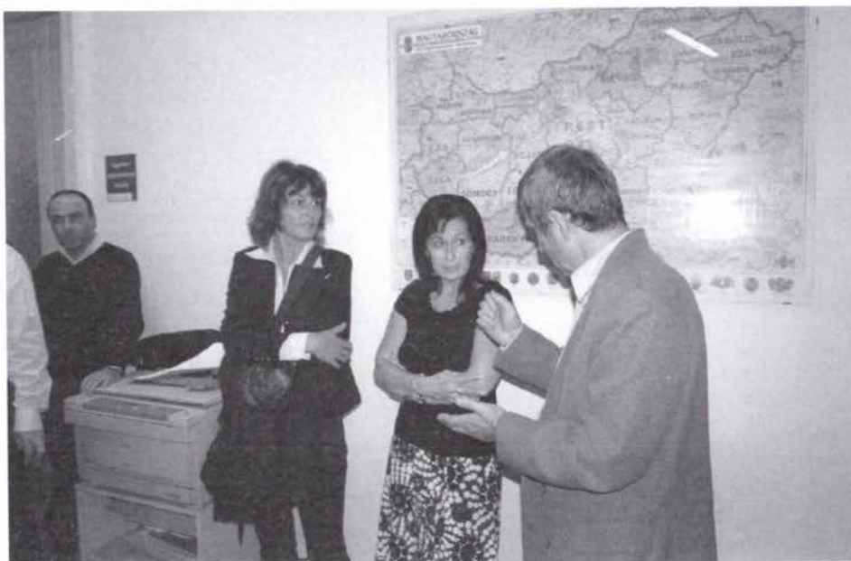
Slika 2. Razmjena važnih informacija.

Zaključno, možemo reći da imamo puno sličnosti i zajednička polazišta u razvoju katastra i geodetske struke, ali u mnogo se stvari možemo ugledati na naše susjede iz Mađarske, jer su dostigli nivo razvoja kojem i mi stremimo i što je najvažnije, voljni su nam pomoći u našim nastojanjima. Stoga je, svaki kontakt i razmjena iskustava s našim susjedima Mađarima na bilo kojem nivou od velike koristi i otvara nam nove vidike i mogućnosti.