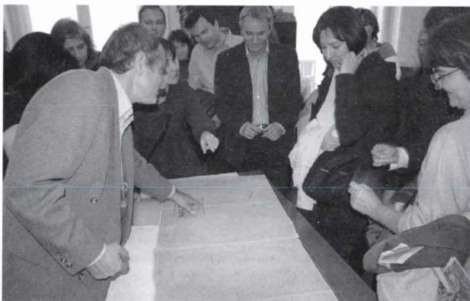
Slika 1. Susret hrvatskih i mađarskih kolega u Pečuhu.

U Republici Mađarskoj postoji 19 županijskih ureda i ured u glavnom gradu Budimpešti, što je također slično kao u Hrvatskoj. Katastarske izmjere u Mađarskoj, kao i u Hrvatskoj, započete u 19. stoljeću imale su također burnu povijest: od grafičke izmjere u Austro-Ugarskoj Monarhiji, izmjere između dva svjetska rata te u socijalističkom sustavu nakon 2. svjetskog rata, koji je bio pod strogom kontrolom tadašnjega Sovjetskog saveza. U tom razdoblju veći dio zemljišta je nacionaliziran i konfisciran, a upravljanje poljoprivrednim zemljištem povjereno je novoosnovanim zadrugama (kolhozima i sovhozima), dok se privatno zemljište ograničilo na kuće s okućnicom. Iz tih razloga, posjed je bio okrupnjen i nakon 1960. započele su katastarske izmjere uglavnom fotogrametrijskom metodom, čime su za veći dio teritorija izrađeni novi katastarski planovi i osnovane nove zemljišne knjige, a što je bila i nužna pretpostavka spajanja katastra i zemljišne knjige. Padom željezne zavjese 1989. i s demokratskim promjenama dolazi do nove zemljišne politike, koja ide za privatizacijom poljoprivrednog zemljišta.