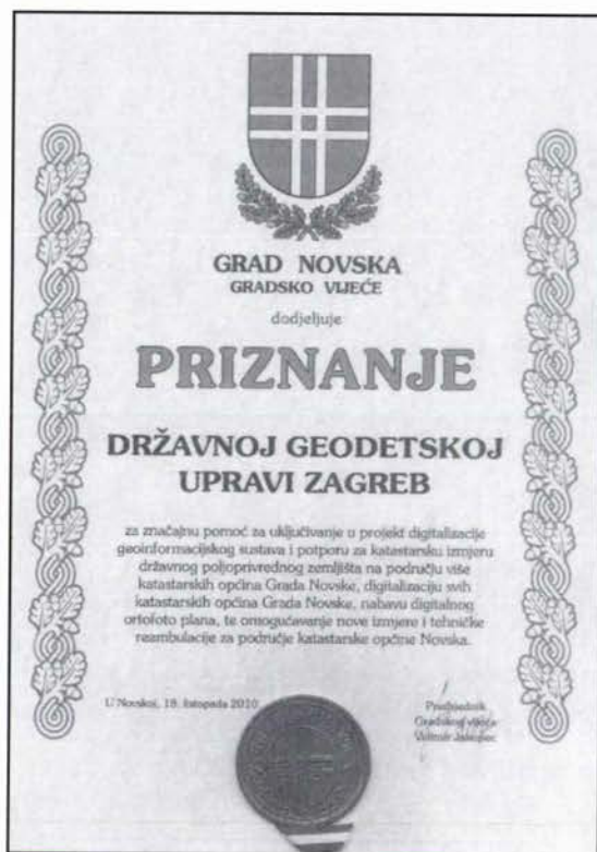
Slika 1. Priznanje koje je Grad Novska dodijelio Državnoj geodetskoj upravi.

i najvećim zahvatima koji su trenutno u provedbi: katastarske izmjere i tehničke reambulacije katastarskih općina Novska i Bročice.