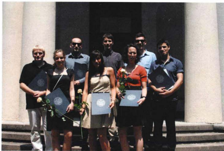
Slika 2. Dobitnici posebne Rektorove nagrade.

Svečana dodjela Rektorovih nagrada održana je 2. srpnja 2010. na Medicinskom fakultetu Sveučilišta u Zagrebu. Prigodom svečane dodjele nagrada bila je organizirana i izložba nagrađenih radova.