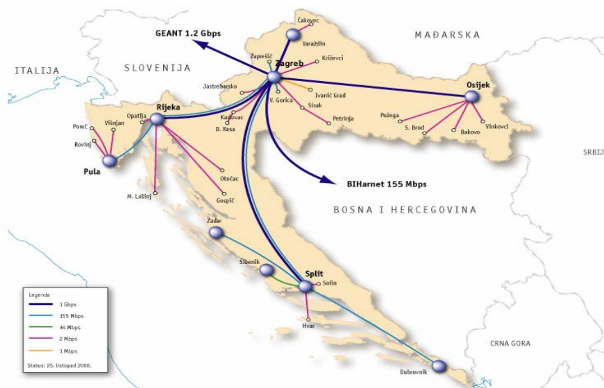
Slika 1. CARNet mreža u Hrvatskoj Figure 1. CARNet network in Croatia

The Faculty of Engineering receives two network spaces (subnets) from CARNet through one link of two VLAN-s, with the two subnets being: 161.53.40.0/24 and 193.198.102.0/24