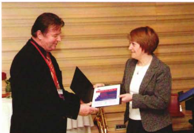
Slika 20. Dodjela zahvalnica zlatnim i brončanim sponzorima kongresa.