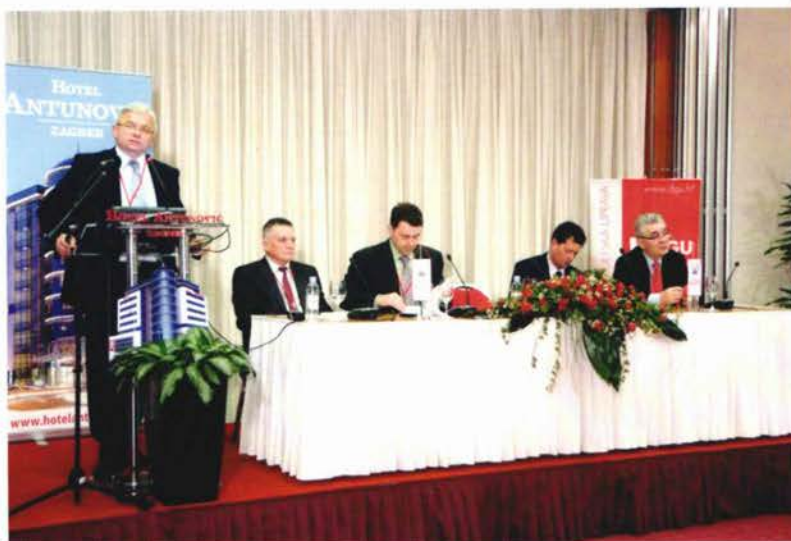
Slika 1. Interno savjetovanje DGU.

Više od 200 sudionika s velikim je zanimanjem pratilo izlaganja najodgovornijih djelatnika DGU.