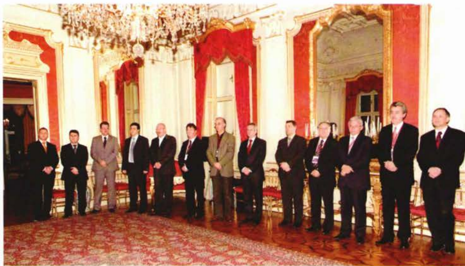
Slika 21. Organizacijski i znanstveno-stručni odbor kongresa s gostima na prijemu u palači Dverce.

Sada, s određenim vremenskim odmakom možemo u miru sagledati rezultate i promicati poruke kongresa. Svima koji su sudjelovali u radu kongresa, svima koji su na bilo koji način doprinijeli uspjehu projekta, ovim se putem zahvaljujem.