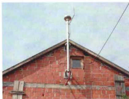
Slika 1. Izgled GPS antene.

Pravilnikom je obrađena nova kategorizacija geodetskih mreža (položajne, visinske, gravimetrijske i magnetometrijske) kao i tehnički kriteriji za pojedine redove mreža te standardi za iskazivanje ocjene točnosti konačnih rezultata.