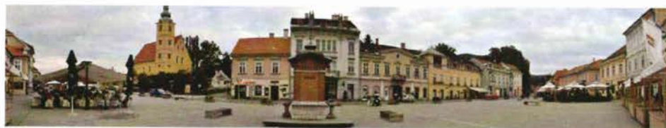
Slika 1. Grad Samobor.

Nakon pet godina od početka katastarske izmjere u Gradu Samoboru, donosimo informaciju o izvršenim radovima i uspješnim koracima prema njezinom kraju koji smo osmislili kod oblikovanja zadatka.