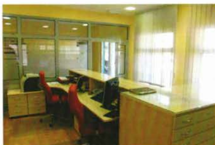
Slika 2. Novi poslovni prostor Virovitice.

Novi uredi katastra prostiru se na tri etaže s vlastitim stubištem i ulazom, a nalaze se u dijelu zgrade u ulici Tomaša Masaryka br. 14. U prizemlju je smješten odjel za katastar nekretnina, a na katu su pisarnica, ured pročelnice i odjel za katastarski sustav i informatičku podršku. Arhiv je u podrumu gdje se još nalaze i dva garažna mjesta. Prigodom otvaranja gradonačelnik Grada Virovitice Ivica Kirin zahvalio se svima koji su sudjelovali u ovom projektu vrijednom 6.000.000,00 kuna uz posebnu zahvalu zamjeniku državnog tajnika SDU za upravljanje državnom imovinom Tomislavu Bobanu i ravnatelju Državne geodetske uprave Željku Bačiću na dobroj suradnji.