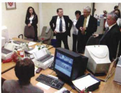
Slika 3. Otvorenje Ispostave Nova Gradiška.

Krajem rujna tekuće godine otvoren je i novi poslovni prostor za Ispostavu Nova Gradiška u staroj zgradi nekadašnjeg suda na Trgu Kralja Tomislava 5. Potpuno je uređeno potkrovlje sa šest novih uredskih soba te postojeći prostori sa svim pratećim sadržajima. U financiranju za uređenje zajednički su sudjelovali Državna geodetska uprava, Brodsko-posavska županija, Svjetska banka i grad Nova Gradiška te im se ovim putem zahvaljujemo na pruženoj potpori u realizaciji ovog projekta.