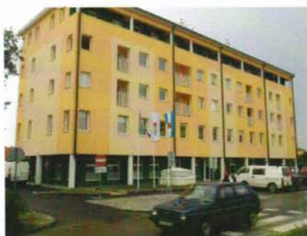
Slika 1. Pročelje zgrade PUK Virovitica.