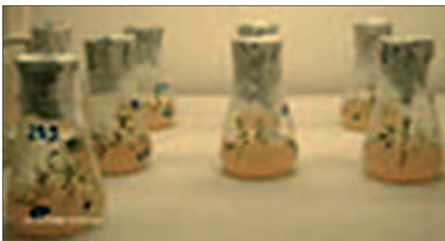
Slika 2. Kultura bijele topole u klima komori Picture 2 Culture of white poplar in climate chamber

prosječnih 1,8; dok se na podlozi M2 povećao na 13,45 po eksplantatu. Izbojci su bili vitalni, normalnog oblika i boje za bijelu topolu, ali različite visine.