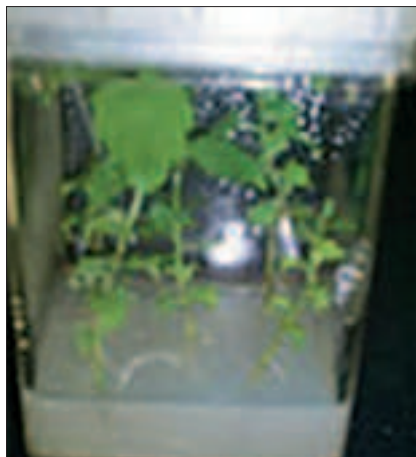
Slika 4. Kompletne individue u magenti Picture 4 Complete individuals in magenta

Za zakorjenjivanje su se koristile podloge Z (sa 0,1 mg/l IBA) i BH (bez hormona). Naime, u cilju inicijacije formiranja korijenčića su izbojci, veličine 3–4 cm, presađivani na podlogu Z , na kojoj su kultivirani idućih sedam dana. Nakon toga su, ovako tretirani izbojci, ponovo prebacivani na svježju podlogu i to podlogu bez hormona, na kojoj je dolazilo do razvoja korijenovog sustava. Zakorjenjivanje je bilo stopotno za obje linije multipliranih izbojaka.