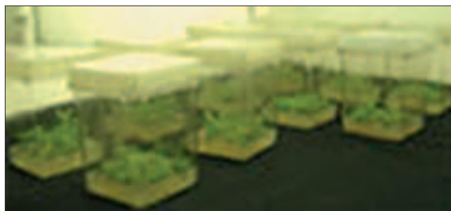
Slika 3. Kulture bijele topole nakon četiri sedmice kultiviranja Picture 3 Cultures of white poplar after four weeks of cultivation

Nakon “žrtvovanja” eksplantata i prikupljanja podataka svježe i suhe mase izračunali su se i osnovni