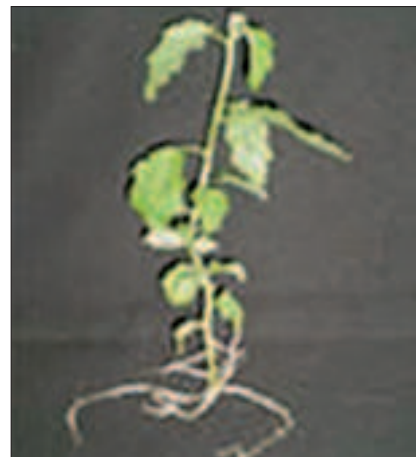
Slika 5. Kompletna individua Picture 5 Complete individua