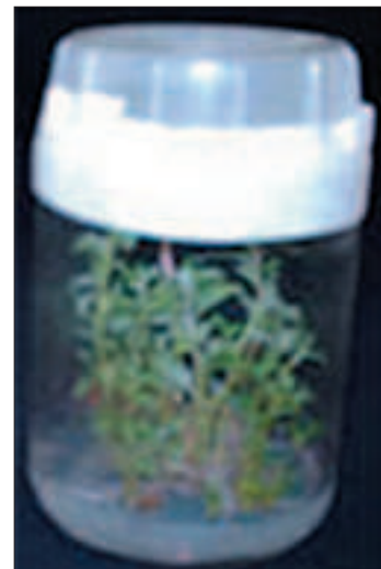
Slika 1. Izbojci bijele topole Picture 1 Sprouts of white poplar

U ovom pokusu biljni materijal su bili eksplantati bijele topole ( Populus alba L.) koji su uzgojeni u in vitro uvjetima u Italiji, (Firenze Scienze e Tecnologie Ambientali Forestali).