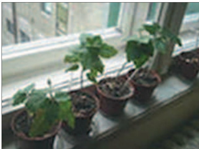
Slika 7. Aklimatizirane biljke bijele topole na uvjete ex vitro . Picture 7 Aclimated plants of white poplar on ex vitro conditions

biljke nisu imale dovoljno razvijenu kutikulu, funkcionalan stomatalni aparat, dobru vaskularnu vezu između korijena i izbojka, slabo razvijene korijenske dlačice, itd., te je bilo potrebno postepeno ih navikavati na uvjete ex vivo . To je postignuto privremenom zaštitom mladih biljaka sa sterilnom staklenom čašom, čije otklanjanje je strogo kontrolirano i vremenski se produžava svaki dan kako bi došlo do razmjene plinova. S druge strane, prvih sedam dana ove su biljke zaljevane sa sterilnom destiliranom vodom, a nakon toga običnom vodom iz vodovodnog sustava.