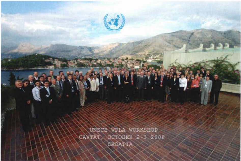
Slika 2. Svi sudionici WPLA Radionice, Cavtat listopad 2008.

Izlazeći iz Kneževa dvora ulazimo u palaču Velikog vijeća, a nad očuvanim ulaznim vratima čitamo natpis: