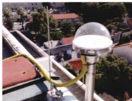
Slika 2. GNSS-stanica Dubrovnik.