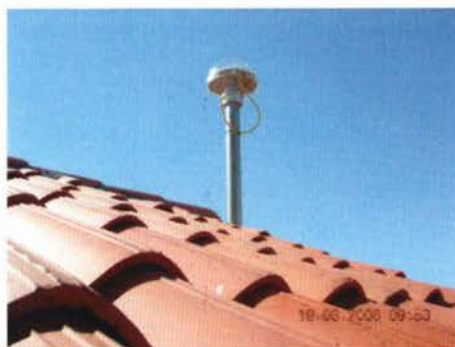
Slika 1. GNSS-stanica Zadar.

Državna geodetska uprava je tijekom prosinca 2008. godine pustila u rad još jedan online servis pod nazivom CROPOS sustav, odnosno, Hrvatski pozicijski sustav koji predstavlja državnu mrežu referentnih stanica Republike Hrvatske podržanih navigacijskim satelitskim sustavom, čija je svrha omogućiti određivanje položaja u realnom vremenu s točnošću od \pm 2 cm u horizontalnom smislu te \pm 4 cm u vertikalnom smislu na čitavom području države. CROPOS sustav je u rad pustio gosp. Davor Mrduljaš, državni tajnik Ministarstva zaštite okoliša, prostornog uređenja i graditeljstva koji je pritom izjavio: “Vlada RH se odredila na učinkovitu upotrebu web servisa u sklopu e-Hrvatske, a CROPOS uz već postojeće servise od velikog je značaja ne samo za geodetsku struku već i širu zajednicu i gospodarstvo. Zbog rastućih potreba hrvatskog društva, te pogotovo anticipirajući skorbu budućnost kada će svaki mobilni telefon biti opremljen GPS-prijamnikom i navigacijskim kartama, Državna geodetska uprava (DGU) je uspostavila servis CROPOS (CROatian Positioning System – Hrvatski pozicijski sustav). Očekivani interes za korištenjem ovog sustava očituje se u već zaprimljenim zahtjevima za registraciju budućih korisnika i prije službenog puštanja u rad”.