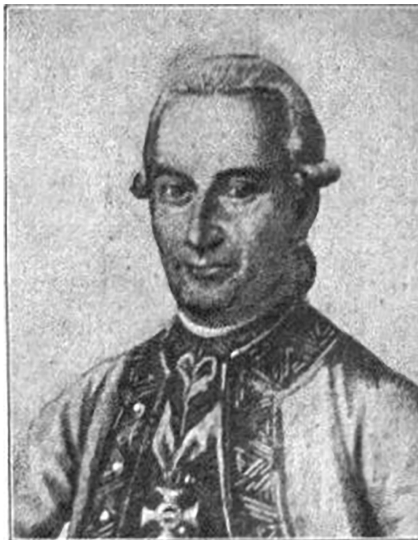
Sisković Josef, Graf, H.M., Ritter und Kommandeur des Theresienordens, Kommandierender Hofkriegsrat, Präsident. † 1785.