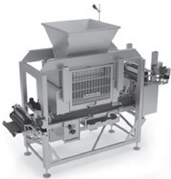
Slika 2. Razdjelnik tijesta