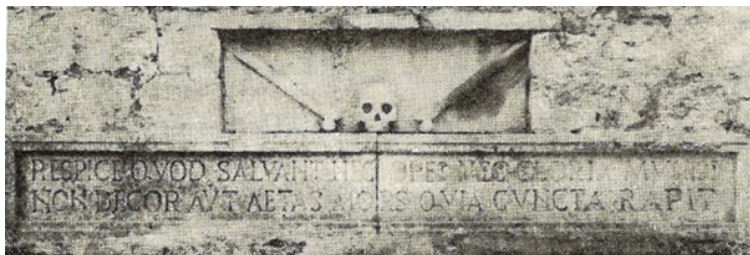
Slika 2. Natpis u ribnjaku: RESPICE..., izvor: N. RAČIĆ, 1970, 246.