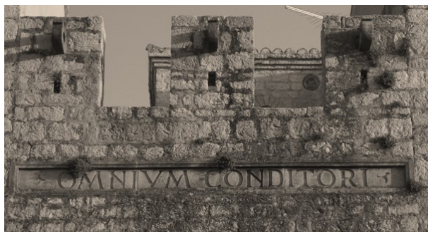
Slika 3. Natpis na sjevernom pročelju Tvrđalja: OMINUM..., izvor: https://croatiareviews.com/media/reviews/photos/original/e0/7c/c6/265-tvrđalj-castle-33-1432309346.jpg (24. 2.2021.)

jedan je od primjera religioznih natpisa na Tvrđalju. Natpis svjedoči o ključnom segmentu Hektorovićeve identiteta – onom religioznom i moralizirajućem. 29 Pjesnik se prema svemu profanom postavljao sa stajališta ove maksime, pa čak i prema gradnji Tvrđalja, s obzirom da ju u Ribanju navodi kao svrhu gradnje. 30 Moralizirajuće tendencije interpretira s frazama ili metrikom velikih antičkih pisaca. Takav postupak sveobuhvatan je u njegovu stvaralaštvu: od književnosti do arhitekture.