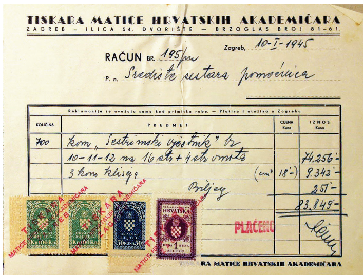
Slika 2. Račun za zadnji broj Sestrinskog vjesnika u 1944. godini (Društvo diplomiranih sestara pomoćnica, HR-DAZG-755 sig 8-13).