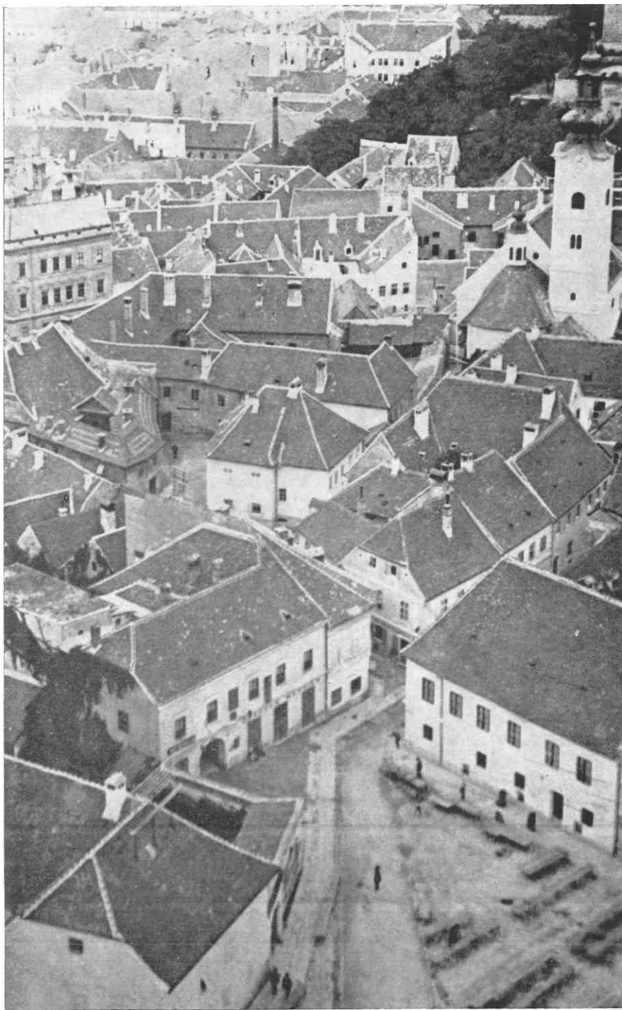
dolac, glavnina kaptolske gradske aglomeracije, snimljena s katedrale, prije rušenja 1925. godine: posljednja žrtva u seriji rekonstrukcijskih zahvata u povijesnoj jezgri zagreba započetih odlukama regulatorne osnove iz 1865. godine.

ćim razvojem bila prisiljena postupno — okroiranim odlukama — otvarati prostor liberalnoj ekonomici. Izgradnja sistema što funkcioniraju kao utvrđena pravila igre u tom prostoru, omeđenom birokratskom ljušturom, smisao je tog zbivanja, koje je nerijetko protuslovno.