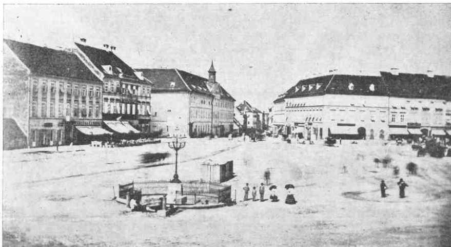
tri snimka trga republike (jelačićevog) iz 60-ih godina prošlog stoljeća prije rektifikacije provedene na temelju regulatorne osnove iz 1865: pogled na jugoistočni dio trga s gornjeg grada (1860. godine), pogled prema centralnom i zapadnom dijelu trga (prije 1865) i snimak centralnog i sjeveroistočnog dijela trga 1867. za vrijeme proslave otkrića spomenika banu jelačiću.